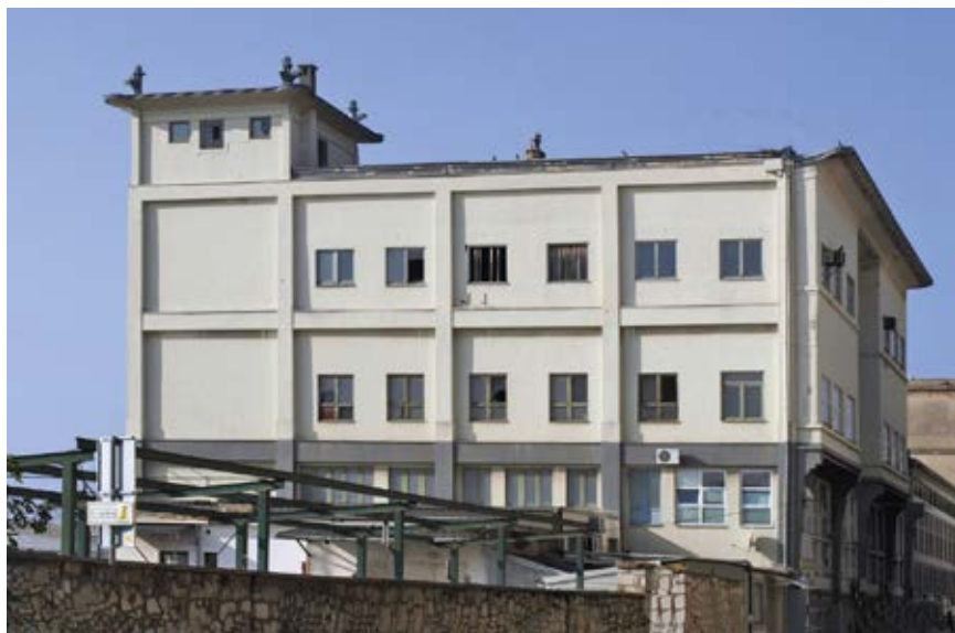
Hotel Emigranti danas

Ono što je iseljenička kuća tj. hotel ili dom ili prenoćište trebao imati je standard higijene koji je već postojao u velikim lukama kroz koje su prolazili iseljenici na putu za bolji život. Pitanje sigurnosti iseljenika tj. nadzor bila je itekako važna komponenta ne samo za Ugarsku kao zemlje iz koje se kreće u svijet već još i više za Ameriku zemlju u koju se dolazi i zato je i organizirana američka konzularna službama u svim iseljeničkim lukama iz kojih su kretali brodovi za Ameriku. U Rijeci je konzularna služba bila organizirana na nivou konzularne agencije, a službu je od 1904. do 1906. obnašao Fiorella Guardia 18 čiji je zadatak bio i da nadzire tijek i organizaciju iseljavanja iz Rijeke u New York te o tome obavještava svoju vladu. Tijekom boravka iseljenika u Rijeci, bilo je angažirano niz službi na gradskom, gubernijskom i državnom nivou. Posebna je uloga gradskog Odjela javne sigurnosti na održavanju reda te medicinskih službi „ljudi iz sjene“ tj. liječnika prisutnih kako kod iscrpnih liječničkih pregleda 19 ili kao članova sanitarnih i drugih komisija čija je riječ odlučujuća kad su u pitanju higijenski, zdravstveni i humani