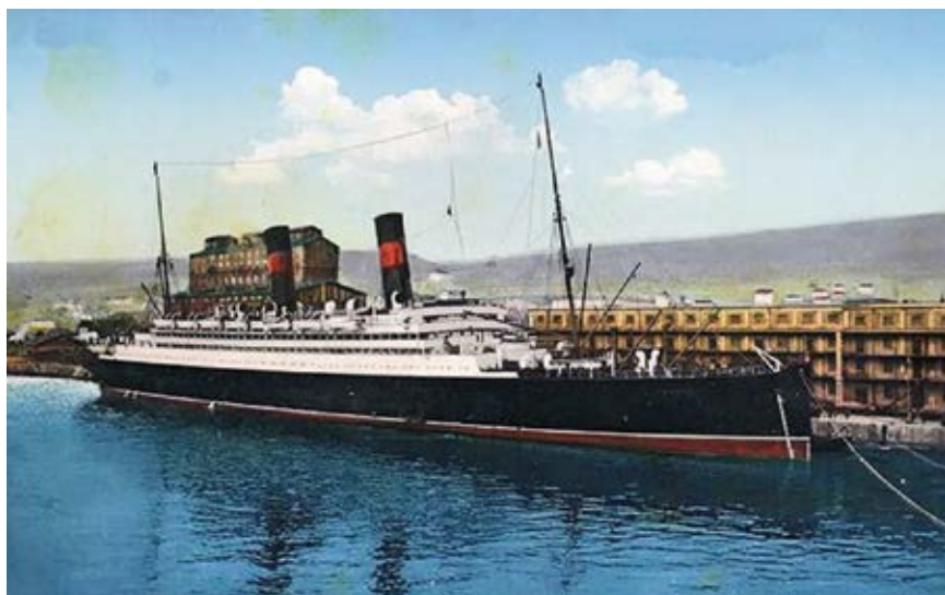
Parobrod „Caronia“ na Molu Rodolfo molu (danas Orlando gat) pred polazak s iseljenicima za Ameriku