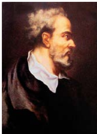
Fig. 1b: Ritratto di Gerolamo Cardano - Scuola fiorentina (periodo 1600 – 1624) olio su tela. Complesso vasariano, Galleria degli Uffizi, Firenze, Italia

Fig. 1a - Medal of Girolamo Cardano, 1501-1576 by Leone Leoni, Cardano's contemporary. It is probably the most faithful image of Cardano available.