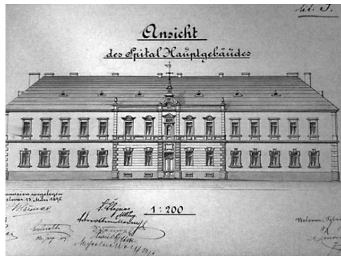
Slika 2. Nacrt glavne bolničke zgrade vojne bolnice iz 1899. godine

Glavna je jednokatna samostojeća zgrada prema navedenome novom planu imala po sedam prozora sa svake strane, uz glavni ulaz u središnji hodnik koji je prozorima gledao na dvorišnu stranu (slika 2.). U središnjem dijelu zgrade nalazile su se stepenice na prvi kat zgrade, uz koje su se s desne strane nalazili sanitarni čvor sa zahodima i pisoarima, a s lijeve soba za mahnite ( Tobzelle ) s predvorjem, bez predviđenoga kreveta. S lijeve strane hodnika bili su liječnička ordinacija, ljekarna i laboratorij, ured bolničkog ekonomata, soba za sedam bolničara i jednog dočasnika te u produžetku kraka hodnika ostava, ispiraoonica (praonica) te bolnička kuhinja. S desne strane hodnika gdje je na prethodnim planovima bio stan namijenjen pukovnijskom liječniku, nalazili su se prijamna liječnička soba (umjesto prijašnje operacijske dvorane), soba za tri bolničara, soba za jednoga bolesnog vojnika ( Izolierzimmer ), soba za dva bolesnika s jednim bolničarom te u produžetku soba za tri teška bolesnika i jednog bolničara. Sada je ovakva zgrada imala 565,16 m 2 (slika 3.). Na prvome katu zgrade nalazila se s desne strane stubišta kupaonica, a s lijeve sanitarni čvor sa zahodima i pisoarima. Ravno je bila kupaonica, predvorje i dvije sobe