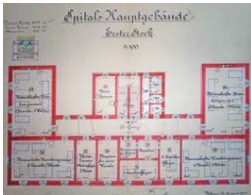
Slika 4. Nacrt prvoga kata glavne bolničke zgrade vojne bolnice iz 1899. godine

Prema pisanju ondašnjih tjednika, radovi su brzo napredovali pa su već u rujnu 1900.