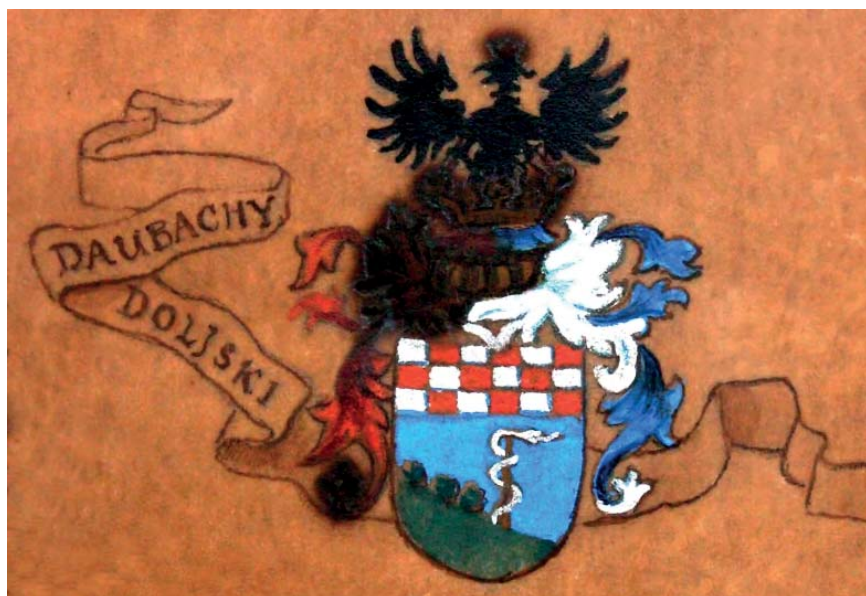
Grb obitelji Daubachy-Doljski