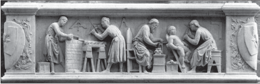
Panonski klesari u svojoj radionici. Detalj sa grupne skulpture na fasadi crkve sv. Orsan-Michele u Firenci

Pannonian stonemasons in their workshop. Detail from group sculpture on church facade St. Orsan-Michele's Church in Florence