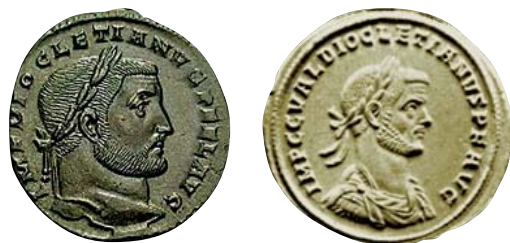
Folisi s likom zdravog Dioklecijana na početku i znakovima bolesti pri kraju vladavine (284.–316.)

U vezi sa Sirmiumskim mučenicima već vekovima pažnju teologa, istoričara, arheologa, čak petrologa, zaokuplja jedna neobična priča o Panonskim, odnosno Fruškogorskim mučenicima, poznata pod nazivom „Passio Sanctorum Quattuor Coronatorum“, u slobodnijem prevodu „Mučeništvo četiri svetitelja ovenčana vencem slave“ ili jednostavno «Pasija». Sačuvana je u rukopisima na latinskom jeziku, koji se nalaze u bibliotekama Vatikana, Milana, Verone, Pariza, Berna, Minhena i nekih drugih evropskih centara [5,10]. Neki od njih preostali su samo u fragmentima, poput Minhenskog manuskripta, koji je napisan 810. godine u Benediktinskom manastiru u Frajzingu ( Freising ), a nalazi se u Gradskoj biblioteci u Minhenu [11]. Na grčkom jeziku pronađen je samo jedan loš prevod iz XII veka [10]. Za mnoge istraživače Pasija je dokument iz IV veka od suštinskog značaja, a za druge neka vrsta fantastične priče, bez istorijskog kredibiliteta [12]. Ti rukopisi zapravo su prepisi, ali i kasnije obrade izvornog teksta, koji u originalu nije pronađen. Naime, neki od prepisivača nisu se doslovno držali originalnog teksta rukopisa, pa su iz toga proistekle brojne nejasnoće u pogledu imena ovih mučenika, vreme-