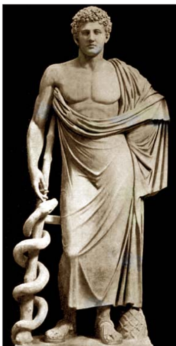
Eskulap sa svojim simbolima zmijom i štapom.

Zapravo, ne zna se pouzdano od koje je bolesti Dioklecijan bolovao i kada je, koje godine, umro. Po tom pitanju se istraživači i hroničari umnogome razlikuju. Pored već spomenutog blažeg moždanog udara, F. Bulić u već navedenom delu daje prikaz Dioklecijanove bolesti i uzroka smrti, kako su ih opisali neki hroničari: da je, sit života, umro od gladi i žalosti ( Laktantius ), da je poremetio umom ( Eusebius ), a u jednom drugom spisu