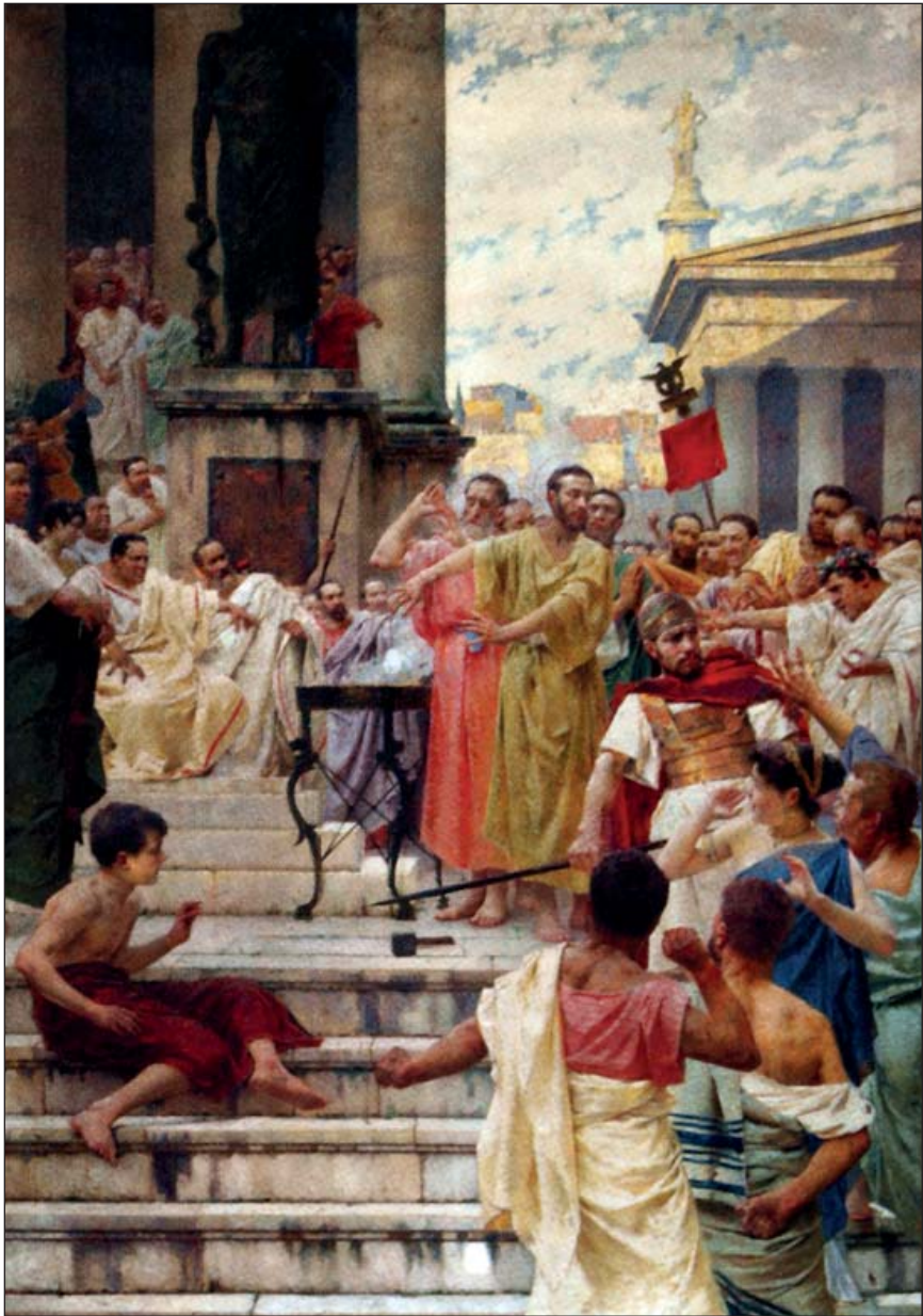
Mato Celestin Medović: Srijemski mučenici. Mato Celestin Medović: Martyrs of Sirmium