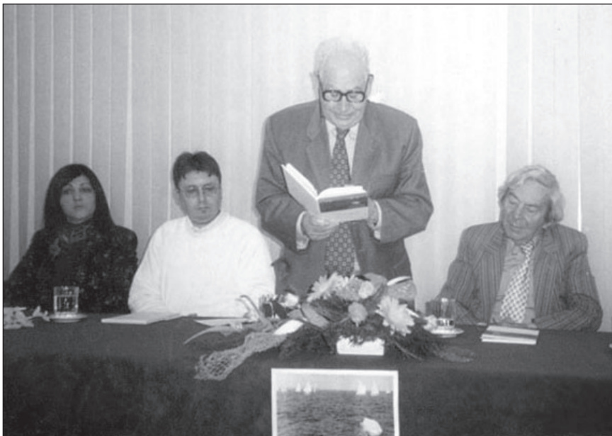
S promocije zbirke Litrati u Zadru

Mediterranski, južnjački temperament autorov sklon je kratkom, lapidarnom izričaju u kojem se akcentuiraju i sažimaju bitne karakteristike omiljenih prizora, pojava i motiva. Svi oni nalaze svoju podudarnost i komplementarnost s fotografijama koje precizno, potaknute umjetničkim nervom sjajnog opservatora, love detalje iz svakodnevice, obogaćujući naše vizualno iskustvo kroz čaroliju fotografskog oka.