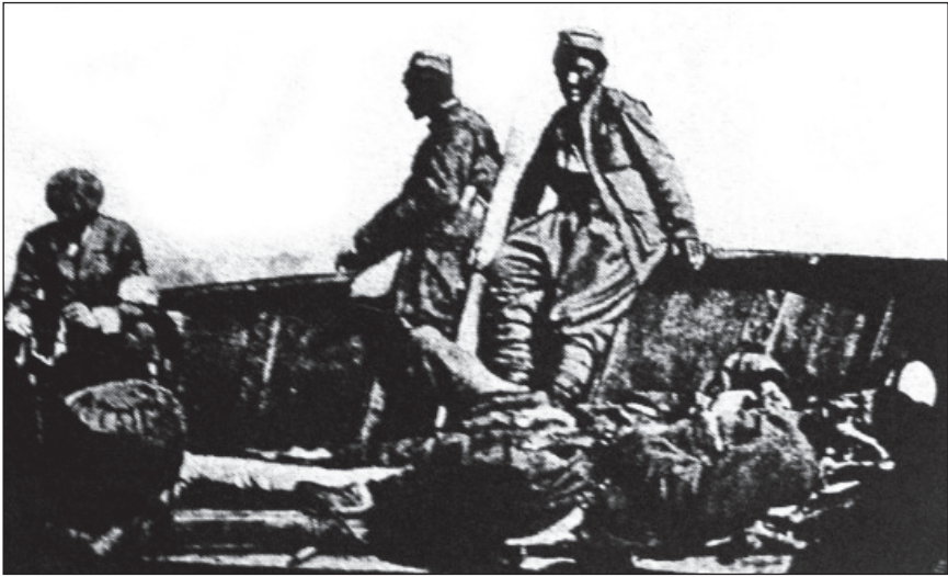
Crnogorski ranjenici na šleperu što ga je vukao parobrod «Nettuno» na Skadarskom jezeru

Wounded Montenegrin soldiers on a barge tugged by a steamship Nettuno on Lake Scutari