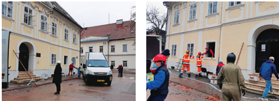
Slike 4-5. Evakuacija gradiva iz Petrinje, siječanj 2021.

nja kako bi gradivo bilo spašeno od propadanja (stečaj, prodaja, likvidacija poduzeća i sl.), odgovarajući popis bibliotečnih jedinica nije izrađen u trenutku primopredaje. Zbog toga stvarni broj naslova djela možemo samo pretpostaviti, a prema okvirnoj procjeni riječ je o još oko 1.500 naslova i 50-ak stručnih časopisa. Vrijedan dio naše knjižnice nalazio se je u petrinjskom Centru, a uključivao je u velikom dijelu bibliotečni fondus koji je u Arhiv pristigao s arhivskim gradivom Učiteljske škole u Petrinji, kao i knjižnične jedinice pristigle u Arhiv s već spomenutim fondovima Vojni komunitet Petrinja i Gradsko poglavarstvo Petrinja. Osim zanimljivih enciklopedijskih izdanja i rječnika, u Petrinji su se nalazili i neki rarijetni primjerci shematizama Vojne krajine, zbirke zakona (19. i početak 20. stoljeća), kao i stari školski udžbenici na njemačkom i hrvatskom jeziku. S obzirom na opisane okolnosti, dio stručne knjižnice koji se je nalazio u Sabirnom arhivskom centru moguće je iskazati samo u dužnim metrima polica koje je zauzimao, a riječ je o ukupno 80,7 dužnih metara bibliotečnoga gradiva.