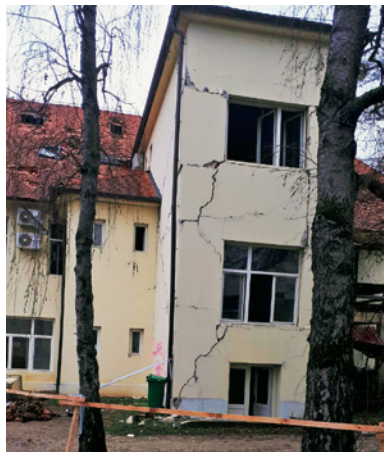
Slika 1. Pogled na stražnji dio zgrade Sabirnoga arhivskoga centra Petrinja, siječanj 2021.

dobio i svoj samostalni ulaz. Vjerojatno i zbog toga oštećenja u prizemnom dijelu zgrade nisu tako teška kao u ostatku objekta.