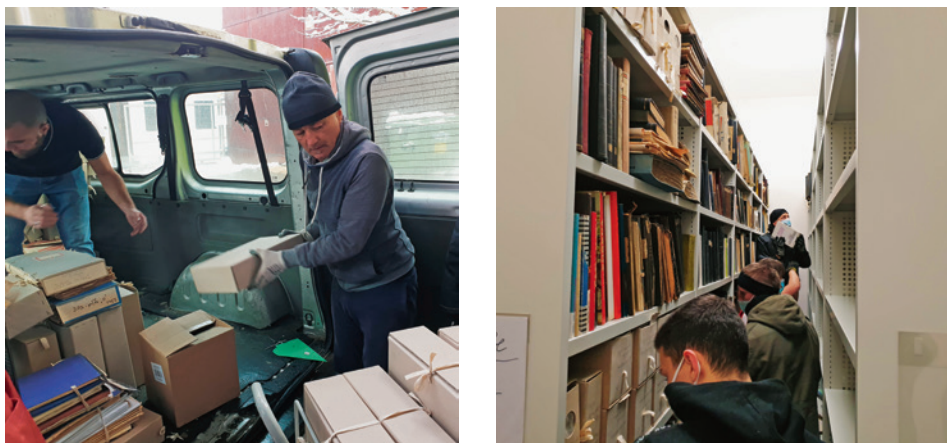
Slike 6-7. Prihvat arhivskoga gradiva u Sisku, siječanj 2021.

potreba da se gradivo preveze i smjesti u sisačka arhivska spremišta uz što je moguće manje štete, a po mogućnosti sačuvavši već uspostavljeni red unutar svakoga pojedinoga arhivskoga fonda i/ili zbirke kako bi to gradivo u što kraćem roku moglo opet postati dostupno korisnicima ( Slika 6 i Slika 7 ). Osim što je upravo dostupnost gradiva članovima zajednice krajnji i osnovni cilj njegove zaštite, svijest o tom da su petrinjski fondovi iz područja uprave nezamjenjiv izvor podataka i dokumenata u vidu građevinske dokumentacije (lokacijskih, građevinskih i uporabnih dozvola zajedno s projektnom dokumentacijom) koja će biti neophodna za obnovu potresom teško ranjene Petrinje, naložila nam je poseban oprez pri obavljanju toga izvanrednoga zadatka.