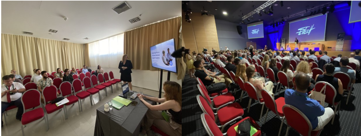
Figure 1. The 2nd CyHeMe special session (on the left) and IEEE SpliTech 2024 opening session (on the right)

This second CyHeMe special session has taken place on-site, with all the authors presented their research live. The special session has been executed as a multidisciplinary, 1,5 hours long special session and attracted practitioners and researchers across disciplines: information security and cybersecurity, medicine, health sciences, software engineering, computer sciences, art, digital health, digital forensics, criminalistics, public security. Participants from government, public, academic and civil sectors have investigated challenges and exchanged knowledge to ensure the convergence of current and future cybersecurity efforts in health and medicine. This special session has examined some of the critical factors that enhance information security and cybersecurity of systems and services that promote health and well-being through not only technical, but also organizational and user-driven mechanisms.