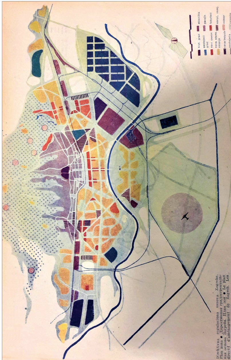
Slika 1. Prijedlog iz 1949. godine

noga standarda bili najdinamičniji (priklučci na vodovod, kanalizaciju, plin, električnu mrežu i telefonski priključci) – najskromniji u planovima izgradnje i sveukupnoga razvoja grada, a s druge strane možda je upravo odraz osamdesetih godina, kada Hrvatsku i Jugoslaviju zahvaća ekonomska, politička i društvena kriza.