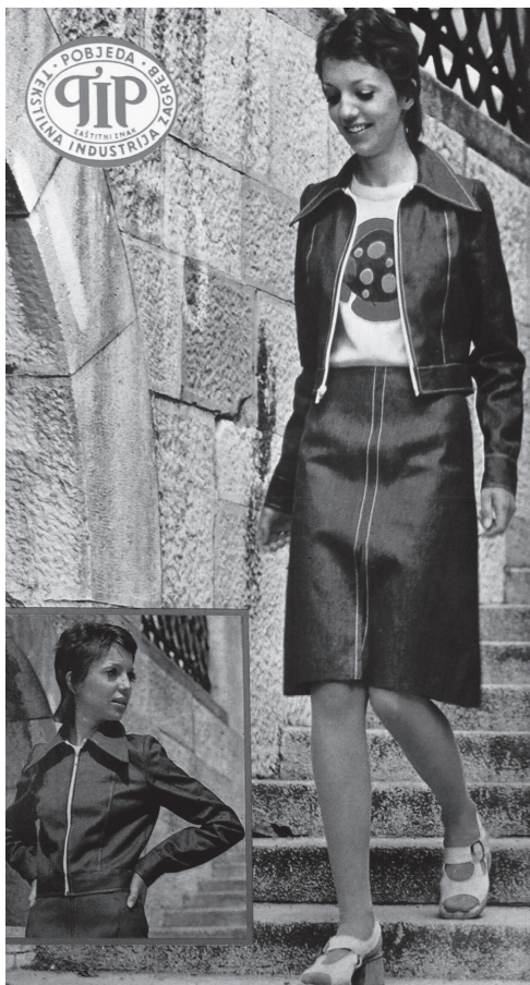
Slika 3. Reklama tvornice Pobjeda: suknja i bluzon od pamučne jeans tkanine (Elle – Ona, 15. 7. 1971.)

TVORPAM, Unitas i Tekstil export-import). 96 Iste godine TVORPAM se zbog osiguravanja kvalitetne pređe udružuje s Predionicom Zagreb i Predionicom Klanjec u Tekstilni kombinat Zagreb (TKZ). 97 Politika udruživanja, sve potrebija zbog pritiska tržišta, nastavlja se i u idućem razdoblju. Proizvođači tkanina i konfekcije od diolena radi zajedničkih nastupa na sajmovima i revijama organiziraju se od 1967. u klub Diolen. Članovi kluba su: Volnenka,