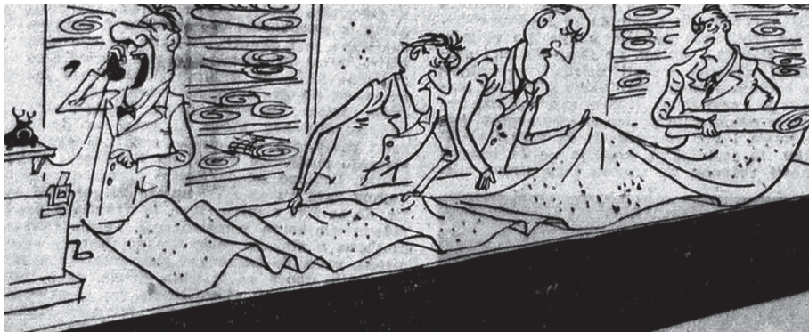
Slika 1. Karikatura vezana uz tekst o bonifikaciji (Vjesnik u srijedu, 1. 6. 1960., 4)

vilo trojno: niska primanja + palac + bonifikacija = zadovoljstvo na radu”, što bi značilo da su se niska primanja mogla kompenzirati varanjem kupaca u izmjeri metraže i prešućivanjem odobrenja popusta (slika 2). Takve, kupcima neprimjetne, prakse omogućavale su trgovcima veću zaradu. 56