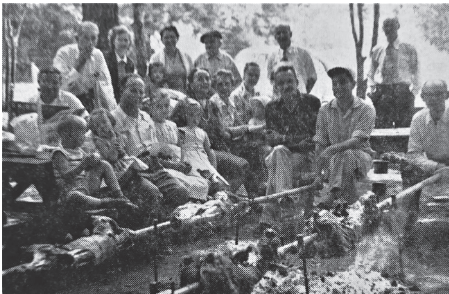
Fotografija 3. Pečenje janjaca na HND-u u Portlandu 11. kolovoza 1957. godine

podacima više ne spominje. S obzirom na to da je glavni organizator te manifestacije u drugoj polovini pedesetih godina bio HSS-ov Međunarodni odbor za Pacifik, 100 vrlo je vjerojatno da je manifestacija ugašena istovremeno s prestankom djelovanja toga odbora. 101 U SAD-u se HND održavao i u Clevelandu, a o njemu postoje dostupni pisani podaci počevši od 1962. pa do sredine osamdesetih godina. 102 U Clevelandu je HND održavan svake godine 4. srpnja, na američki Dan nezavisnosti, a organizirala ga je HSS-ova organizacija „Matija Gubec” iz Clevelanda, koja se ujedno nakon Drugoga svjetskog rata bila razvila i u glavno središte HSS-ove djelatnosti u SAD-u. 103