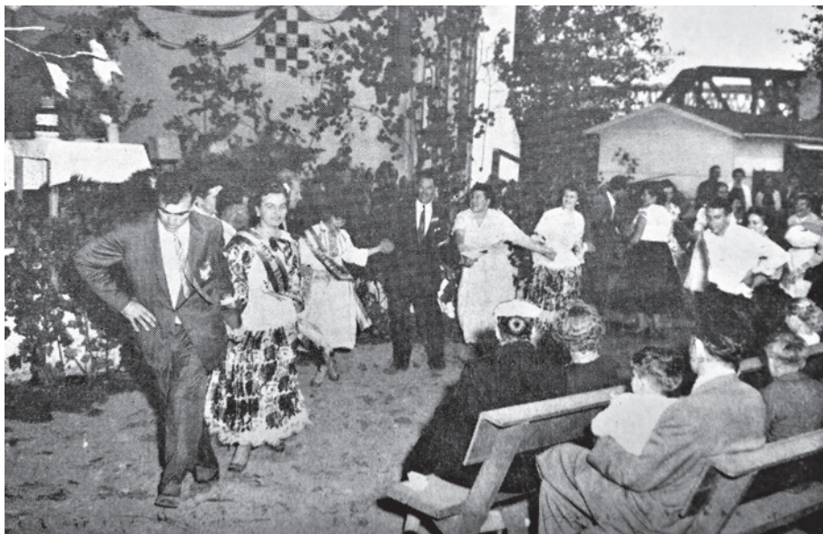
Fotografija 2. Plesanje „Seljančice” na HND-u u Vancouveru 14. rujna 1958. godine

Prvi HND na zapadu SAD-a organiziran je u Portlandu 1953. 98 i održavan je u tom gradu do 1964. godine. 99 Poslije se HND u Portlandu u dostupnim