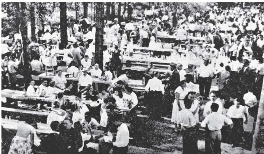
Fotografija 1. Hrvatski narodni dan u Wellandu 1. srpnja 1957. godine

Prvih godina HND u južnom Ontariju održavao se na kanadski Dan nezavisnosti 65 1. srpnja, 66 a već od sredine pedesetih godina nadalje nije bilo strogo određeno da se održi baš 1. srpnja, nego je znao biti i nekoliko dana prije, krajem lipnja, ili čak kasnije, oko sredine srpnja. 67 Osamdesetih godina manifestacija u južnom Ontariju znala je biti održana i tijekom lipnja. 68 Bez obzira na datum održavanja, poveznica HND-a u južnom Ontariju s kanadskim Danom nezavisnosti vrlo se često spominjala.