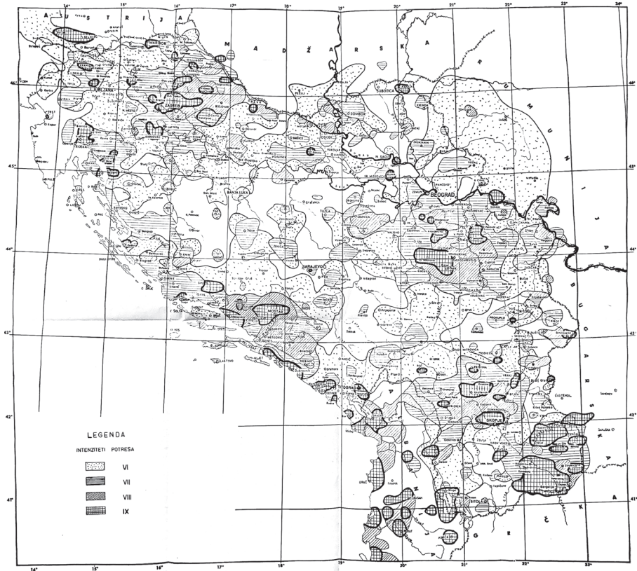
Slika 1. Seizmološka karta FNRJ iz 1950., prilog Pravilniku o privremenim tehničkim propisima za građenje u seizmičkim područjima (1964.).

potresa u Skopju 1963. godine. Taj pravilnik donio je prvu seizmičku državnu kartu s potresnim zonama od VI. do IX. zone prema Mercalli-Cancani-Siebergovoj ljestvici (slika 1), koja je potjecala iz 1950. (zato nije bila označena državna granica Jugoslavije s Italijom ispod Bovca jer je formalno postojao Slobodni Teritorij Trsta), a posljedično je bilo određeno da za svaku pojedinu građevinu projektant konstrukcije treba tražiti precizne podatke od lokalnoga seizmološkog ureda. U tehničkom pogledu taj je pravilnik uveo dinamički proračun te se može smatrati da građevine proračunate nakon njegova stupanja na snagu imaju bitno veću seizmičku čvrstoću nego prije, a strukture koje su se nalazile u gradnji bile su naknadno seizmički ojačane, poput čuvenih nebodera Rakete na Vrbiku arhitekta Vjenceslava Richtera i suradnika. Šezdesetih je godina pri donošenju zbirke propisa za konstruiranje, proračun, montažu i održavanje čeličnih konstrukcija bila uvedena karta kojom je državni teritorij podijeljen na tri zone s obzirom na djelovanje vjetra (slika 2).