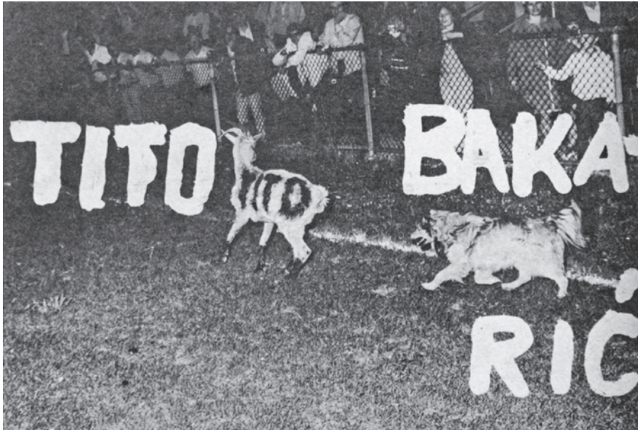
Fotografija 3. Hrvatska država (Berlin – München), kolovoz – rujan 1972., str. 5. Izrugivanje Josipa Broza Tita i Vladimira Bakarića na poluvremenu nogometne utakmice.

svoj utjecaj, a zanimljivo je kako im se iz zemlje pomagalo slanjem igrača i trenera, dok su projugoslavenski orijentirani klubovi, NK Dalmatinac, NK Jadran i drugi, bili prepušteni sami sebi i nisu uživali nikakvu pomoć iz zemlje, stoga su u MIH-u zaključili da bi se pod hitno trebao povući igrački i trenerski kadar iz klubova pod utjecajem političke emigracije, a potpomoći „lojalne” klubove. 133