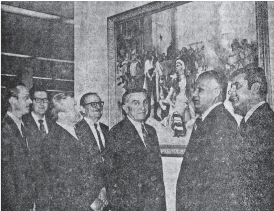
Fotografija 1. Zajedničar (Pittsburgh), 5. 7. 1972., str. 2.