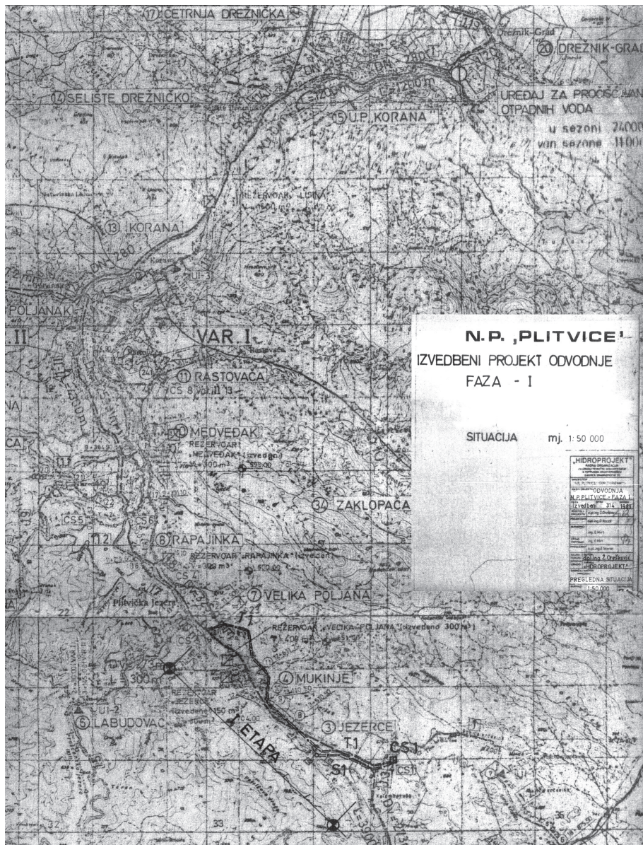
Slika 4. Kartografski prikaz izvedbenog projekta odvodnje NP Plitvice – faza 1 iz 1989.