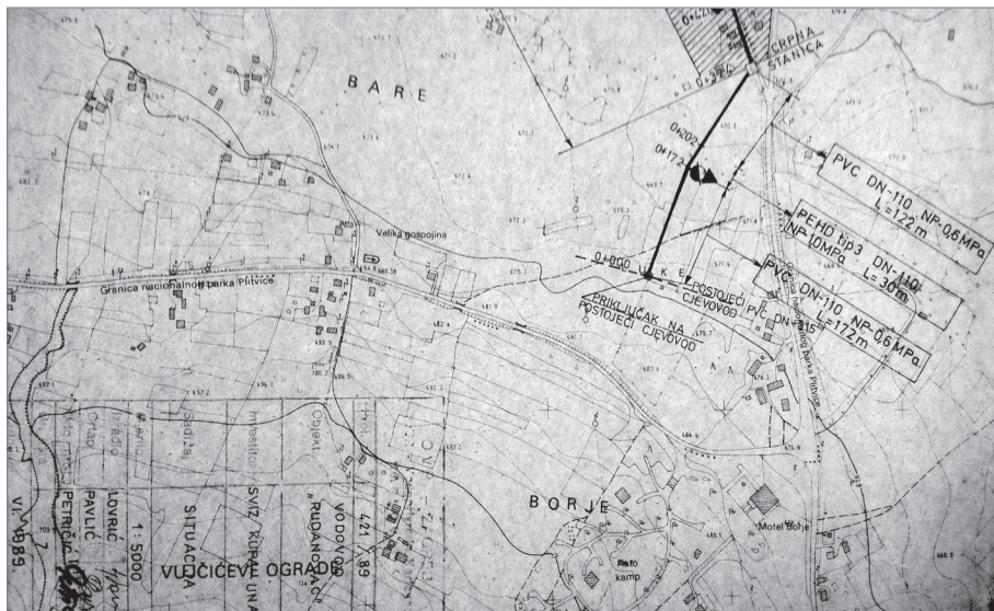
Slika 2. Nacrt budućeg vodovoda u iz Rudanovca u Vrelo Koreničko.