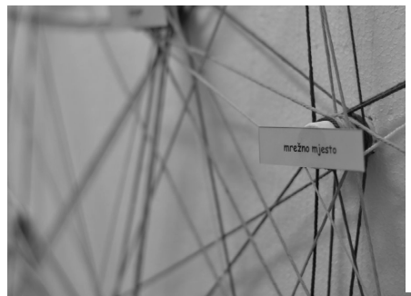
Slika 3. Izrada instalacije Gramatika mreže

su instalacije izrazile gramatičko pravilo suradnje 12 sektora kreativne industrije kao postavku kreativne ekonomije. Povezivanjem pojmova upisanih u Gramatici mreže pokazuju se potencijali umrežavanja 12 sektora u najbrže rastuću industriju.