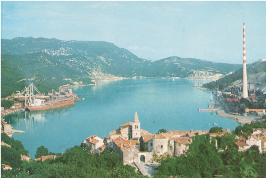
Prilog 3. Bakarski zaljev s gradom Bakrom, lukom i terminalom za rasuti teret (lijevo) i koksarom (desno), oko 1980. godine

Većina je industrijskih objekata srušena odmah po zatvaranju koksare, dok je dimnjak srušen 2005. godine, tijekom šestomjesečne intervencije (Radović 2005). Posljednji su objekti predviđeni za rušenje uklonjeni 2010. godine, kada je ujedno provedena sanacija platoa na kojem se nalazio kemijski pogon koksare. 3 No, iako zatvorena, bakarska koksara i dalje predstavlja djelatan čimbenik u rekreiranju lokalnih identiteta, u narativizaciji i problematizaciji gradske prošlosti i sadašnjosti te zamišljanju postindustrijskih budućnosti. Pritom u prvi plan dolaze lokalne predodžbe o onečišćenju, shvaćene u užem smislu rizika i štete počinjene po okoliš i zdravlje stanovništva, ali i u širem značenju stigmatizacije i društvene kontaminacije čitave zajednice opasnim onečišćujućim faktorom (Douglas 1984: 3). Upravo suvremene predodžbe i naracije o ekološkim i zdravstvenim učincima koksare, njezinu uplivu na način života stanovništva te njezinoj ulozi u urbanoj simboličkoj geografiji točke su analize u nastavku rada.