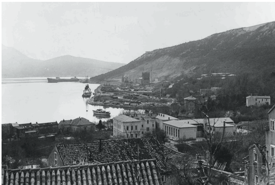
Prilog 1. Panorama Bakra s gradilištem koksare, ožujak 1977. godine (67768/1-41521)