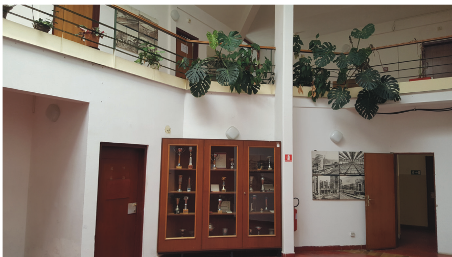
Prilog 4. Predvorje nekadašnje upravne zgrade koksare, danas poslovnog prostora, sa zidnim fotografijama izgradnje postrojenja i s vitrinom osvojenih pokala sa sportskih natjecanja zaposlenika koksare, 18. rujna 2018. godine