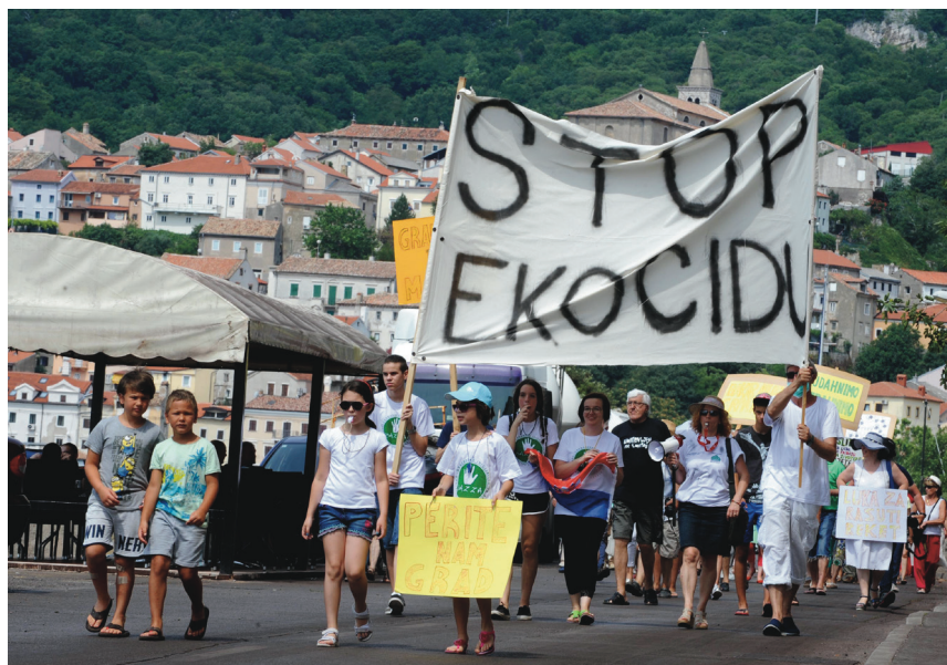
Prilog 5. Prosvjed u Bakru protiv zagađenja iz bakarskog terminala za rasute terete, 24. lipnja 2017. godine

No, pri intervjuima je naglašena svijest da zatvaranjem koksare nisu nestali svi onečišćivači u blizini Bakra. Među njima se posebno ističe terminal za rasute terete, gdje se zbog prekrcaja rudače i neadekvatnog zbrinjavanja viška onečišćuje more. U zraku je i dalje velika koncentracija čestica prašine, posebice za vjetrovitih dana, što stvara crni talog na objektima i zahtijeva konstantno čišćenje kućanstva, kako je pojasnila jedna od sugovornica: “Ja ću danas zapolne i jutre provest va čišćenju, aš je čera bila bura.” Godine 2017. Građanska inicijativa Za Bakarski zaljev i zaleđe BazZa organizirala je prosvjede kako bi, porukama poput “Stop ekocidu”, “Grad na moru bez mora”, “Imamo pravo na čisti zrak”, “Za čista pluća grada Bakra” i sl., uputila na zagađenje iz Luke Bakar (Gašpert 2017). Osim onečišćenja koje gradu donosi terminal za rasute terete, u zraku se i dalje može osjetiti neugodan vonj koji podsjeća na miris sumpora, a koji dolazi iz obližnje rafinerije Urinj: “[K]ad se koksara zaprla, vavek su povedeli da smrdi od koksare, sad zna preko noći Urinj smrdet da se ne more živet.”