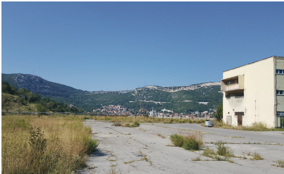
Prilog 6. Pogled na grad Bakar s platoa nekadašnje koksare, 18. rujna 2018. godine