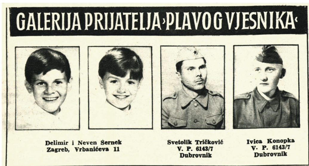
Prilog 3. U rubrici “Galerija prijatelja Plavog vjesnika ” mogle su se pronaći fotografije male djece, ali i mladića na odsluženju vojnoga roka (302/1960: 10)