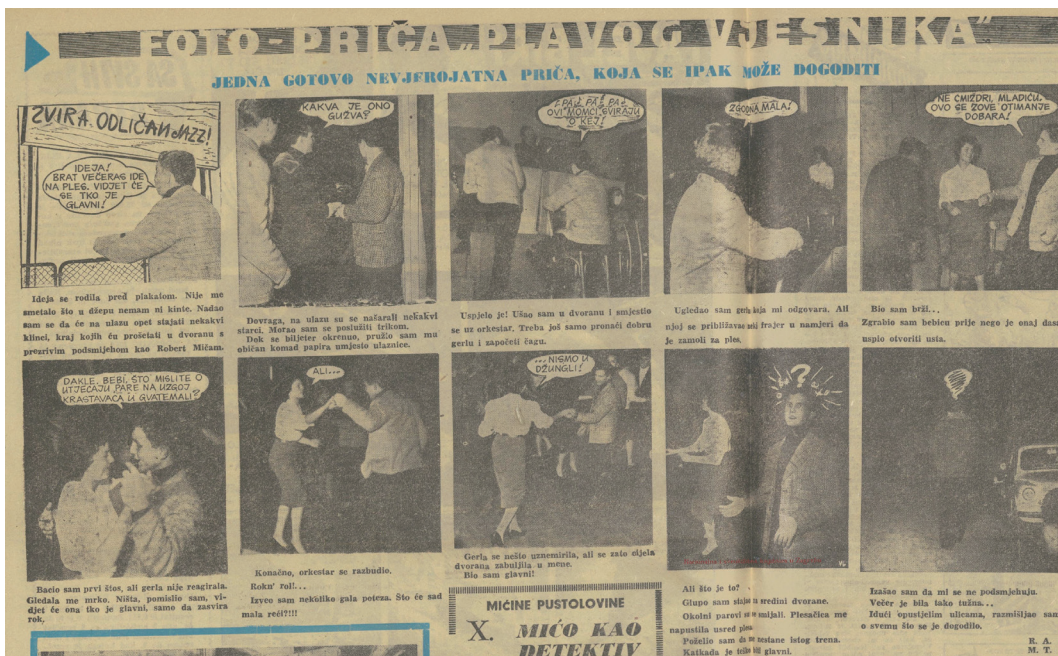
Prilog 1. Fotopriča (232/1959: 8–9) u kojoj se reprezentacija poklonika popularne kulture uparuje s delinkvencijom, imitacijom Zapada, urbanim miljeom, naglašenom seksualnošću i primitivizmom

Četiri godine poslije, kada tvist obuzme dvoranu zagrebačkoga Studentskoga centra punu učenica i učenika na maturalsnoj zabavi, stav novinara Plavoga vjesnika Marka Čolića nešto je blaži, no većina je članka – u maniri tekstova o mladim glumačkim nadama te izvođačicama i izvođačima zabavne glazbe koji su u Plavome vjesniku izlazili pedesetih godina – posvećena učenju i izboru fakulteta, iako je i tvist dopušten dok god plesači i plesačice znaju gdje je njima i tome plesu mjesto: “Neka plešu jer već sutra počinje grozničav rad za knjigama! Na maturi treba pokazati da plesanje tvista nije jedino što je naučila ova generacija maturanata” (453/1963: 7).