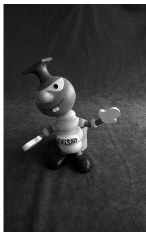
Sl. 2. i 3. Uzorci igračaka proizvedenih u šoltanskome pogonu plastičnih masa / Pictures 2 & 3: Samples of toys produced in Šolta factory of plastic masses