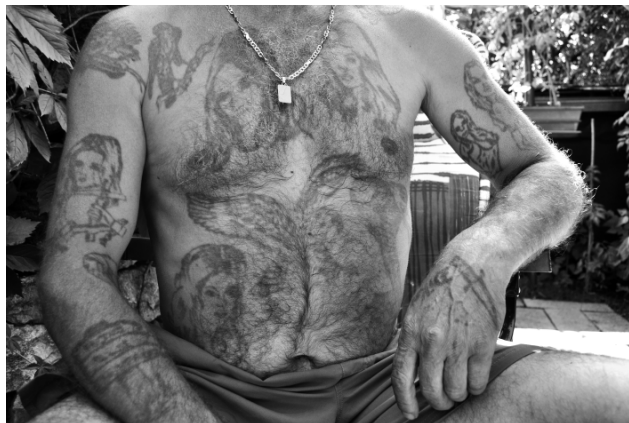
Slika 3. Primjer tetovaže kao "body arta" u pravom smislu riječi

Ekstremni primjer izlaganja tetovaže pogledu oficira našao sam kod čovjeka koji je bio pre-raspoređen na radno mjesto vozača: "voziš pun autobus oficira, svaki je kraj tebe to vidio, ali nitko nije ništa komentirao. Ne znam, možda ih to nije zanimalo ili..."