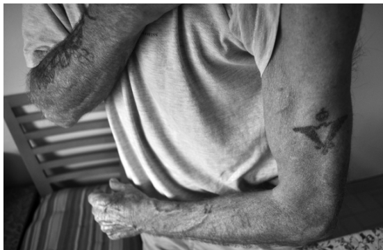
Slika 5. Tetovirani orao (proljeće 2012.)