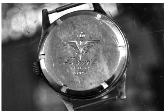
Slika 6. Originalni logotip (proljeće 2012.)

Budući da sam spomenuo novac, kratko ću se osvrnuti na naknadu za izvršenu uslugu. Tetoviranje u JNA temeljilo se na daru (usp. Mauss 1990). Djelatnost tetoviranja se bez iznimke provodila u odsustvu novca, a naknada je obuhvaćala sitno materijalno sredstvo. Ako su u ruskim zatvorima cigarete predstavljale mjeru za veličinu tetovaže (“dimenzija cigarete”) (Condee 2002:47), u jugoslavenskoj je vojsci duhan zamotan u valjak bio primarno sredstvo neposredne razmjene. Priroda darivanja je hijerarhizirala, ali ne na razini društvene ljestvice, već posebnog detalja cigareta: neovisno o boljoj kvaliteti duhana, lošije su kotirale Niška i Morava, dok je potražnja za proizvodima Tobačne Ljubljana bila veća, jer su imali, kao što već samo ime Filter 57 naglašava njihovu inovativnu odliku, mekani dodatak u obliku tuljka na dijelu cigarete koji se prisanja ustima.