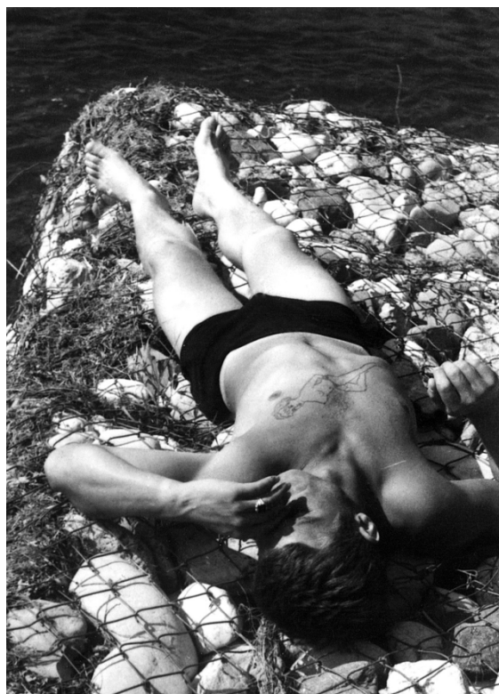
Slika 1. Fotografija iz antikvarijata s natpisom na poledini “Uspomena sa Save” (autor, vrijeme nastanka: nepoznato)

Prije nego što se upustim u daljnje razotkrivanje metodoloških pristupa i analizu etnografskog proučavanja u Sloveniji, mogu zabilježiti da tetovaže iz JNA nisu ni profana djelatnost ušita u kožu isključivo iz kolektivnih razloga, niti individualizirani estetski čin, kako diktira tipizacija glavnine tetoviranja (usp. Schildkrout 2004; Caplan 2000). One se nalaze negdje u sredini , gdje je potrebno obje sfere tetovaže promišljati zajedno. Moglo bi se reći da su tetovaže iz JNA tetovaže prije tetovaža, ako potonje shvatimo kroz zamah estetizacije individualiziranog tijela i komercijalizacije oslikanog tijela. No, one nisu tetovaže prije tetovaža, ako shvaćamo društveni kontekst njihovog nastanka, koji je povezan s temporalnošću (privremenošću) i prisilom (obvezno služenje vojnog roka u Jugoslaviji). Upravo zbog toga u sredini , te središnje pozicije između dva polja, postavljen sam u iritantno odskočiste u univerzum tetovaža iz JNA. Istraživat ću, dakle, wittgensteinovske “obiteljske sličnosti”, minimalni naboj zajedničkih karakteristika tetovaža iz JNA (prema Velikonja 2008:23), kloneći se ranih propozicija, kamo sve mogu sezati tetovirane slike i njihova percepcija.