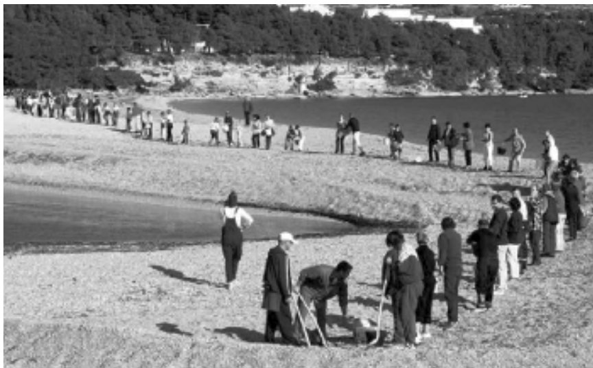
Foto 6: Ivica Jakšić Čokrić Puko & Multimedijalna, putujuća, artistska skupina za mentalnu higijenu, fizikalnu terapiju i brzu prehranu Šušur Bol: akcija Premještanje plaže Zlatni rat na sigurno mjesto, izvan dometa birokratskih struktura (akcija se sastoji iz tri dijela) (2002.–2003.)