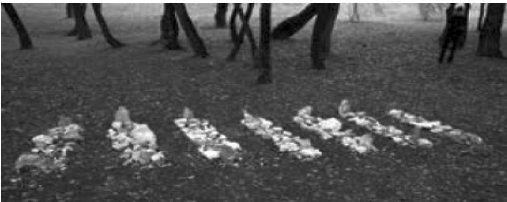
Foto 7: Josip Zanki i Bojan Gagić: Mirila Mirila (Zagrebi! Ekofestival, Bundeck, 2008.)

Jednu od varijanti navedenoga performansa umjetnici izvode na Zagrebi! EkoFestivalu na zagrebačkom Bundecku 13. rujna 2008., i to u formi ranojutarnjega performansa, točnije – kao živu skulpturu, za čije su vrijeme izvedbe odabrali 5.30 sati ujutro u jednom od šumaraka Bundecka, u koji su prethodnoga dana položili sedam izvedbenih mirila – kamenih posmrtnih nakupina, kojima prizivaju ritual uzimanja mjere pokojnika iz podvelebitskoga područja. Kako je navedeni izvedbeni ritual modificiran za žive, umjetnički je dvojac nastojao sudionike žive skulpture dovesti u iskustvo smrti; određenije, rekla bih – iskustvo ležećega položaja dodira smrti. Pritom uz autore performansa i sedmero ležećih izvođača, koji su bili položeni na mirilima, na toj zaboravljenoj arhaičnoj funeralnoj, a ovdje izvedbenoj, praksi okupilo se svega troje posjetitelja. Podsjetimo, performans Mirila zajednički je rad Josipa Zankija i Bojana Gagića koji su prvi put izveli u samostanu Scardavilla kod Forlija u Italiji 2001. godine, a nakon toga izvode ga još nekoliko puta – u Trstu, Bologni i Bostonu. Funeralna je izvedba na Bundecku bila prva izvedba u Hrvatskoj nakon koje su umjetnici upriličili još jednu izvedbu u Galeriji Klovićevi dvori u Zagrebu povodom otvorenja izložbe Mirila – nematerijalna kulturna baština 2013. godine.