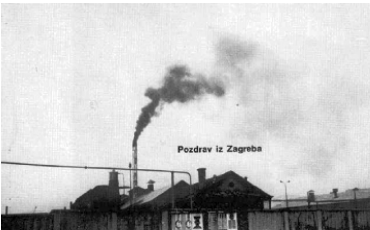
Foto 3: TOK: Pozdrav iz Zagreba (razglednica, Zagrebački salon, sekcija Prijedlog, 1972., offset, 101 × 164 mm)

vraćanje unatrag prema početnim točkama, uz skupljanje papira. Oni papiri koji budu tijekom akcije pogaženi, oštećeni ili odneseni predstavljat će jednu vrstu umjetničkog rezultata: bit će to izbrojeni komunikacijski poeni. Naglašena je praznina papira, povratno skupljanje i priroda materijala akcije, te svojevrsna tišina kojom je akcija obavljena – jezik kao urbani diskurs par excellence ne-prisutan je. Sama akcija ima spiralnu dinamiku razvoja i nauma. Susret dviju bijelih linija (i umjetnika) u paviljonu imat će vizualni i duhovni identitet i značaj spirale kao temeljnog napretka realiziranog gledanja Istog. (Martek i Demur 2001, http)