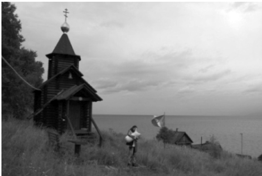
Foto 1: Petar Grimani: Bajkalska topografija (Body Navigation Festival, Sankt Peterburg, 24.–31. listopada 2009.)