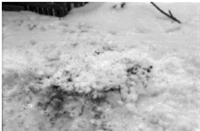
Foto 4: Marijan Molnar: Paljenje papira na snijegu, anonimna akcija (1977.)

Elementi koji su krajnje suprotstavljeni. Osnovno iskustvo s vatrom jest da ona, za razliku od zemlje kojoj je antipod, pokazuje karakter nepostojanog i neuhvatljivog. Njezina prisutnost je sama prolaznost i nestajanje za razliku od trajanja i stalnosti zemlje. Vatra je, govoreći iz tradicije, crveno , zemlja je crno . Izazov je bio adekvatno predstaviti, i vizualno i značenjski, njenu bit. Koristeći metode kvaziznanstvenih pokusa i registrirajući segmente procesa sagorijevanja (toplina, svjetlost), pojavio se problem odnosa metafore i metonimije, znaka i traga. Uхватiti "formu" vatre, njezin likovni ekvivalent. (...) Iz umjetnikova opisa land arta Kvadrat zemlje , 1x1, fotodokumentacija, 1977. (Molnar 2002: 12)