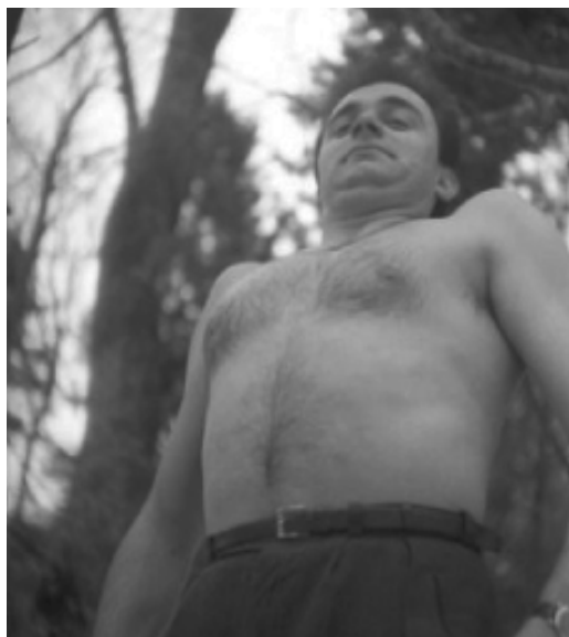
Foto 2: Tomislav Gotovac: Udisanje zraka (serija od dvije fotografije, Sljeme , 1962.)

Zanimljivo je pritom da prvi čin umjetnosti performansa u našem (jugoslavenskome) kontekstu kao prostor izvedbe odabire prirodu – kao neutralni ambijent, potpuno očišćen od svih ideologija, ali jednako tako tjelesan, prirodno bludan , kao i polunago muško tijelo i polunago žensko tijelo u ženskom časopisu (Vuković 2011: 180-181), a ne urbotopos. Dakako, u ovom slučaju priroda je kao ambijent i namjerno odabrana zbog zabrane prikazivanja nagoga tijela u javnosti, kao što, uostalom, navedena zabrana i danas vrijedi. Najnoviji primjer: 13. rujna 2014. svi umjetnici koji su sudjelovali svojim performansima (riječ je o nagim izvedbama) u okviru festivala Zagreb, volim te! , posvećena Tomislavu Gotovcu (Antoniju G. Laueru), bili su privedeni (usp. G. K. 2014, http).