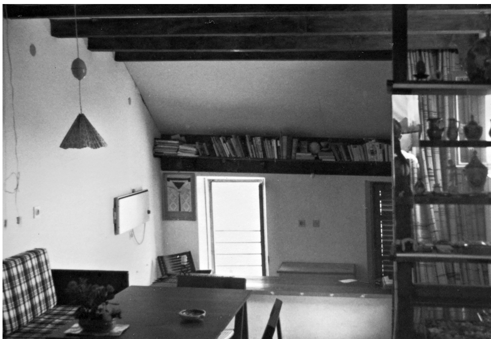
Sl. 4 a) i b) Gornji kat kuće – "treći pod". Prostor za objedovanje i odmor. oko 1976./77. godine.