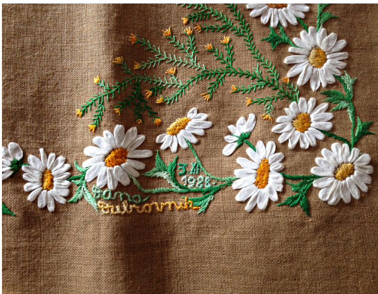
Sl. 7. Detalj stolnjaka. Snimila: Tihana Petrović Lež, 2015. godine.