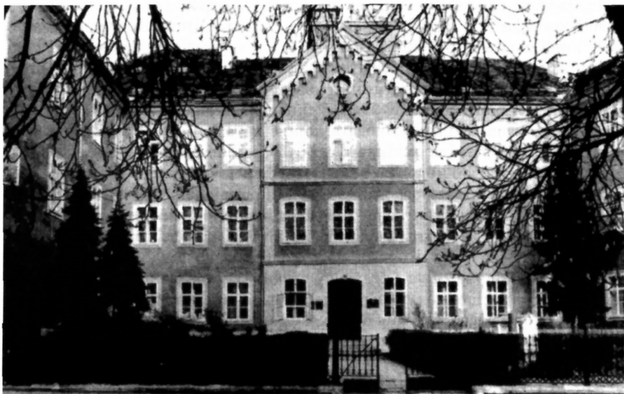
Slika 2. Sjedište Geofizičkog zavoda od 1861. do 1982. godine na Griču u Zagrebu.