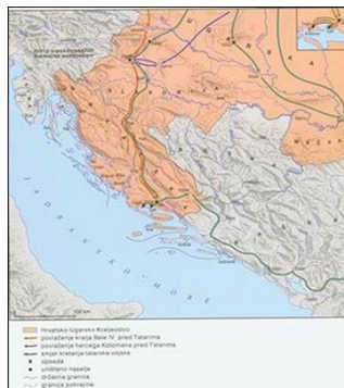
Karta 2. Provala Mongola u Ugarsko-Hrvatsko Kraljevstvo (1241. – 1242.) 263