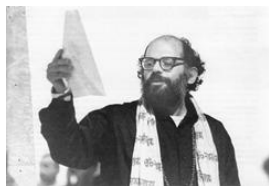
Slika 3. Allen Ginsberg (1926. – 1997.) 638