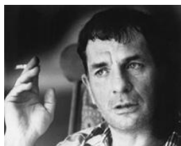
Slika 1. Jack Kerouac (1922. – 1969.) 636

Najvažnija djela Jacka Kerouaca: The Town and the City , 1950; On the Road , 1957; The Dharma Bums , 1958; The Subterraneans , 1958; Doctor Sax , 1959; Visions of Neal , 1959; Maggie Cassidy , 1959; Mexico City Blues , 1959; Tristessa , 1960; Big Sur , 1962; Desolation Angels , 1965.