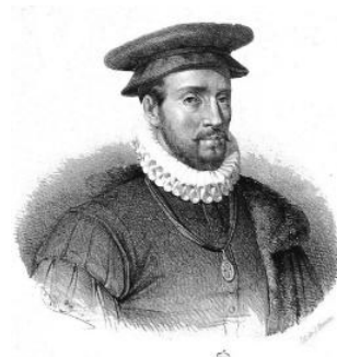
Slika 1. Luis de Requesens 66

Premda se Géronima Esterlich y Gralla u pismu navodi kao žena ambasadora kralja Filipa II., ona je zapravo bila supruga prethodnog španjolskog poslanika u Rimu, Luisa de Requesensa, koji je tu dužnost vršio od 1563. do 1568. godine, 61 odnosno prije svog brata, aktualnog ambasadora Juana de Zúñiga. 62 Ovaj bi kardinalov lapsus mogao sugerirati kako njegov odnos sa španjolskim ambasadorima nije bio pretjerano frekventan. 63 Međutim, u to je vrijeme Requesens kao visoki vojni zapovjednik sudjelovao u gušenju pobune Moriska u Španjolskoj (1568. – 1570.), zbog čega ga je u siječnju 1568. godine zamijenio mlađi brat Juan de Zúñiga. Requesensova supruga Géronima napustila je Rim tek 1570. godine, 64 što navodi na pretpostavku da se očekivao njegov povratak na mjesto ambasadora. Međutim, spletom političkih okolnosti njegov je brat Juan de Zúñiga trajno ostao na mjestu ambasadora u Rimu sve do 1579. godine. 65