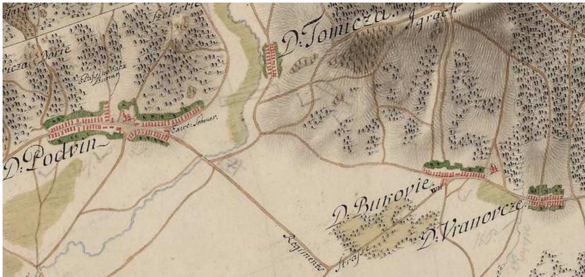
Karta 1. Sela civilne Slavonije – okolica Slavonskog Broda 148