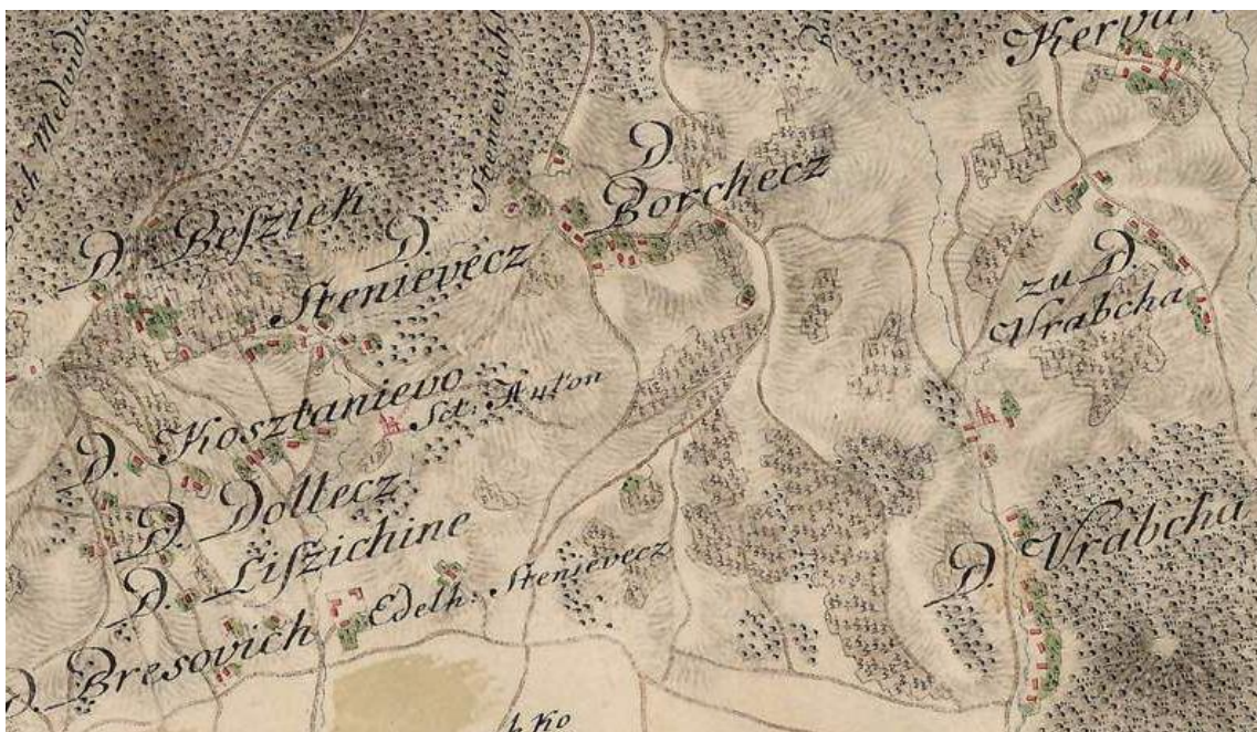
Karta 2. Sela civilne Hrvatske – okolica Zagreba 149