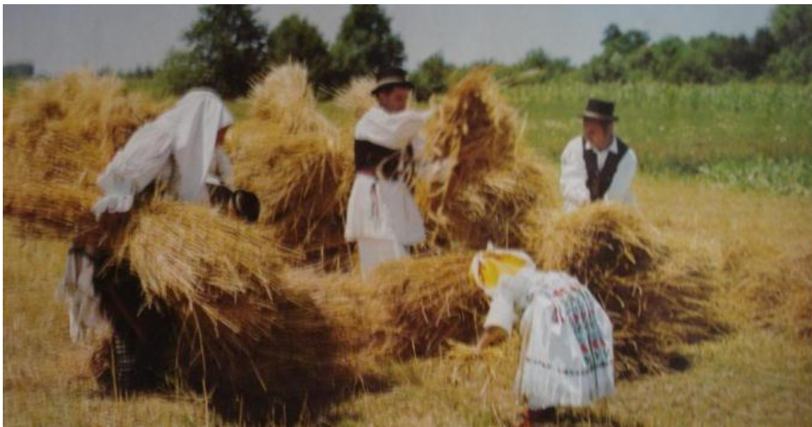
Slika 2. Tradicionalna slavonska žetva. Na slici se vidi i odjeća seljaka nošena u navedenoj prigodi 151