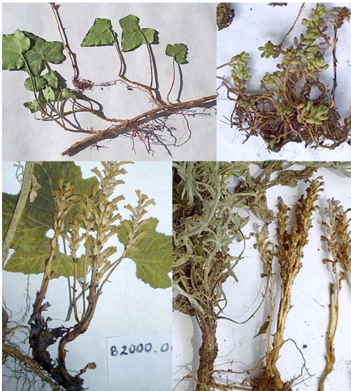
Фиг. 3. Някои системи паразит-гостоприемник: а- P. ramosa с гостоприемник Hedera helix ; б- P. oxyloba по Sedum cf. album ; с- P. mutelii по Xanthium sabulosum ; д- P. oxyloba по Centaurea solstitialis

Fig. 3. Some host-parasite systems: а- P. ramosa with host Hedera helix ; б- P. oxyloba on Sedum cf. album ; с- P. mutelii on Xanthium sabulosum ; д- P. oxyloba on Centaurea solstitialis