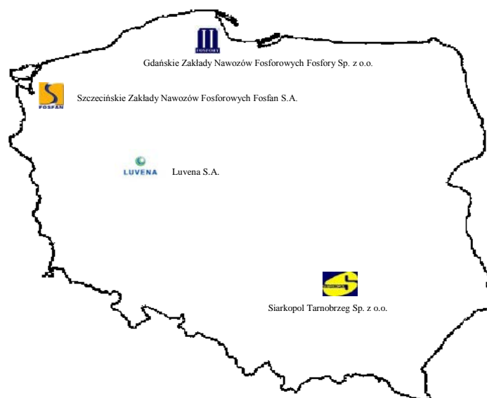
Rys. 1. Największe przedsiębiorstwa produkujące nawozy fosforowe w Polsce

Nawozy fosforowe na skalę wielkoprzemysłową produkują w Polsce cztery zakłady, których lokalizacja została przedstawiona na rys. 1.