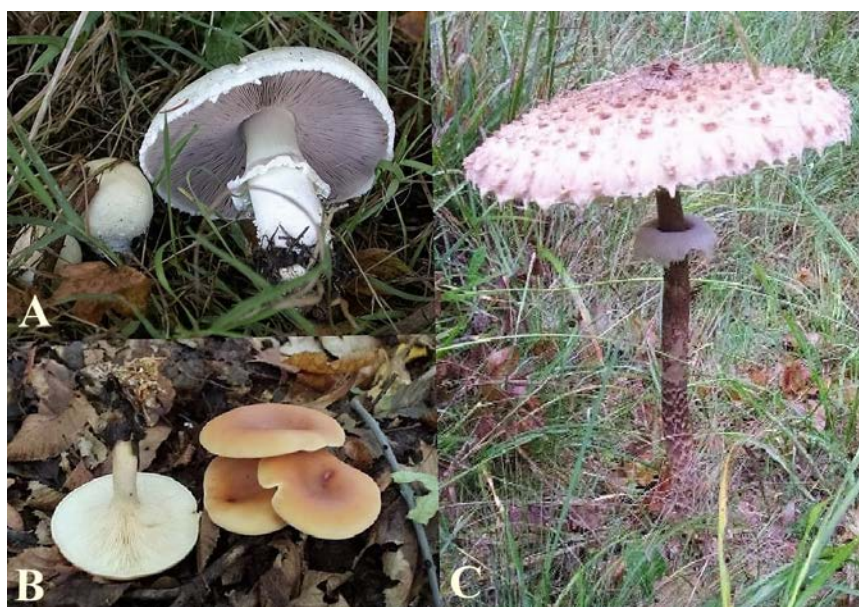
Slika 2. Istraživane vrste gljiva. A) Agaricus macrocarpus ; B) Clitocybe inversa ; C) Macrolepiota procera