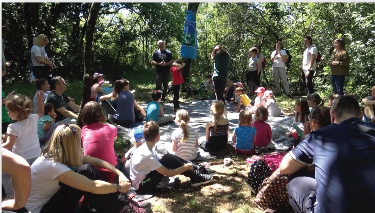
Slika 1: Primjer zelenog programa