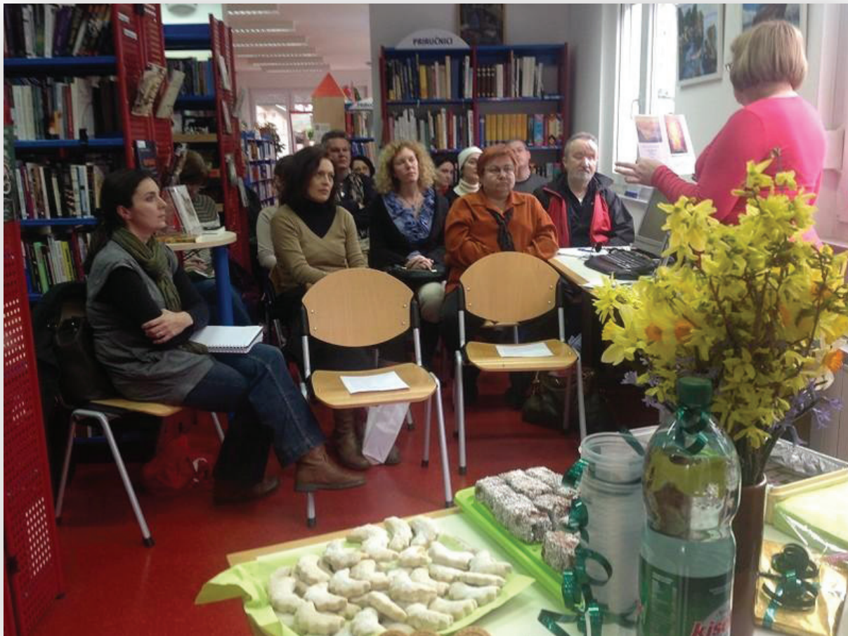
Slika 2: Primjer zelenog programa