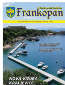
Frankopan: glasilo grada Kraljevice

Razvoj projekta ovakvog obuhvata dugotrajan je i izazovan, međutim, uz stručnu podršku koju pruža matična knjižnica kao koordinator i nositelj projekta te uz zalaganje i entuzijizam knjižničara koji digitalnu građu postavljaju u repozitorij, opisuju je meta-podacima i organiziraju u zbirke, izvjesno je da nas u budućnosti čeka mnogo vrijednog i zanimljivog digitalnog sadržaja.