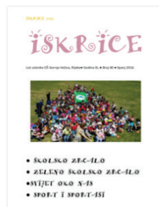
Iskrice: list učenika OŠ Gornja Vežica, Rijeka