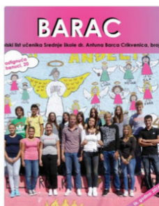
Barac: školski list učenika Srednje škole dr. Antuna Barca Crikvenica