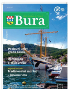
Bura: glasilo Grada Bakra