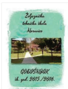
Godišnjak Željezničke tehničke škole Moravice