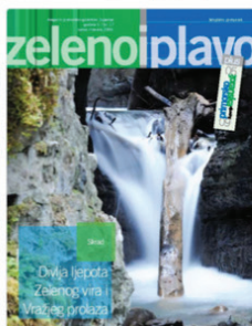
Zeleno i plavo: magazin Primorsko-goranske županije