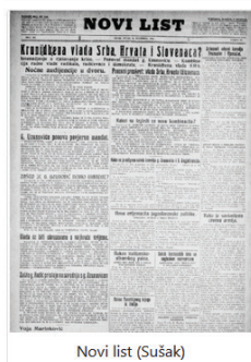
Novi list (Sušak)