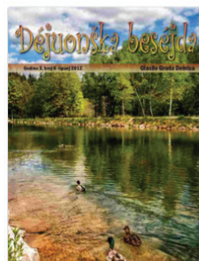
Dejuonska бесејда: glasilo Grada Delnica