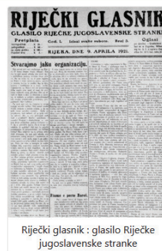
Riječki glasnik : glasilo Riječke jugoslavenske stranke