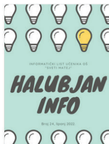
Halubjan info: informatički list učenika OŠ „Sveti Matej“