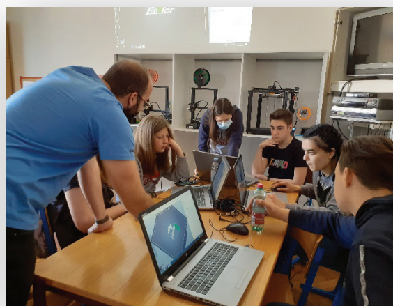
Slika 14. Radionica 3D modeliranja, edukatori iz CTK-a

Školska knjižnica nije samo izvorište i odredište u traženju, pronalaženju i korištenju znanja i informacija već i kreativna učionica u kojoj korisnici (učenici) kroz različite aktivnosti i projekte otkrivaju i realiziraju vlastite potencijale. Transformacija knjižnice u 3D laboratorij trebao bi, pored već rečenoga, osigurati veću angažiranost i interes učenika za sudjelovanjem i uključivanjem u navedeni projekt i sve ostale aktivnosti koje knjižnica organizira i provodi.