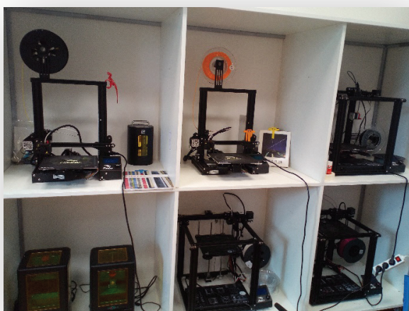
Slika 13. 3D pisari

Projekt 3D LAB osmišljen je kao dugoročni projekt koji se provodi u kontinuitetu. Svake školske godine planiraju se konkretne teme i aktivnosti koje se realiziraju u definiranom vremenu. Na početku školske 2019./2020. godine nabavljena su dva 3D printera kao početna oprema za realizaciju ovoga projekta. Dugoročnost se ogleda i u tome što bi sami učenici koji su stekli vještine i kompetencije prenosili znanje i mentorirali ostale učenike. Važno je istaknuti i to da je prostor knjižnice Prometne i Strojarske škole zajednički te da su inicijalno ideju o transformaciji naše školske knjižnice u zajednički 3D LAB osmislile školske knjižničarke ovih škola. Dio aktivnosti vezanih uz ovaj projekt provodile bi obje škole suradnički (primjerice nadopuna opreme, edukacija, organiziranje posjeta institucijama i udrugama i sl.), a dio aktivnosti svaka škola kreira posebno vezano uz specifičnosti i potrebe struke.