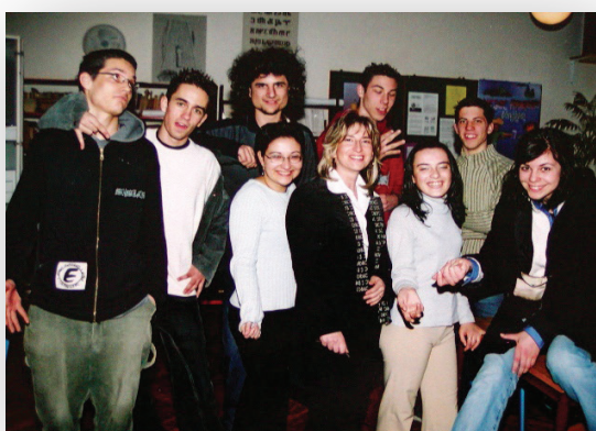
Slika 3. „Lovac“ – scenska igra

Mladići koji izvode ovu scensku igru neobično su zrelo i glumački umješno ušli u tkivo pisca, prezentirajući njegov negdašnji i njihov današnji odnos, stav i problem. Na predlošku novele o smrti sestre tematiziraju pitanja ljubavi i smrti, tame i svjetla, tražeći izlaz. Ono što valja napomenuti njihovo je vladanje scenskim prostorom i scenskim govorom koji je prirodan, ostrašćen i uljuđen. Dobar je odabir glazbene kulise koji je također dvovremen i napokon završni komentar svojstven izrazu današnje generacije.“ 6