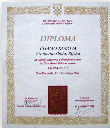
Slika 2. Diploma za osvojeno 1. mjesto

Ovom smo predstavom prvi put nastupili na LiDraNu i sasvim neočekivano, postigli veliki uspjeh. Predstava je na državnom natjecanju, tada je LiDraNo bio natjecanje, a ne smotra, proglašena najboljim ostvarenjem u dramskom izrazu u konkurenciji između četrnaest scenskih igara iz cijele Hrvatske. Tom prigodom izveli smo je i za svečanost zatvaranja pred prepunim Domom kulture u Novom Vinodolskom.