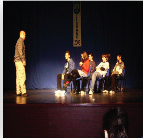
Slika 8. „Sat lektire“ scenska igra, 2006.

„ Sat lektire “ naziv je scenske igre nastale iz suradnje dviju škola (Prometne i Strojarske škole) i Gradske knjižnice Rijeka, Kornera za mlade. Naime, u povodu obilježavanja Mjeseca hrvatske knjige pozvani smo u osmišljavanje programa pod nazivom „Tko kaže da mladi ne čitaju poeziju?“. Odlučili smo se za suvremene hrvatske autore, od Janka Polića Kamova, Dražena Cuculića, Krešimira Pintarića, Sime Mraovića do Damira Urbana i tekstova poznatih riječkih bendova Parafa, Termita, Leta 3 i Drill Skillza, koji su u časopisu Književna Rijeka 8 u Petom elementu Igora Večerine dobili status poezije. Prvotno pomalo „slamersko“ kazivanje poezije dodatno smo dramatizirali i sa „Satom lektire“ otišli na LiDraNo. Predstava je bila predložena za državnu razinu natjecanja.