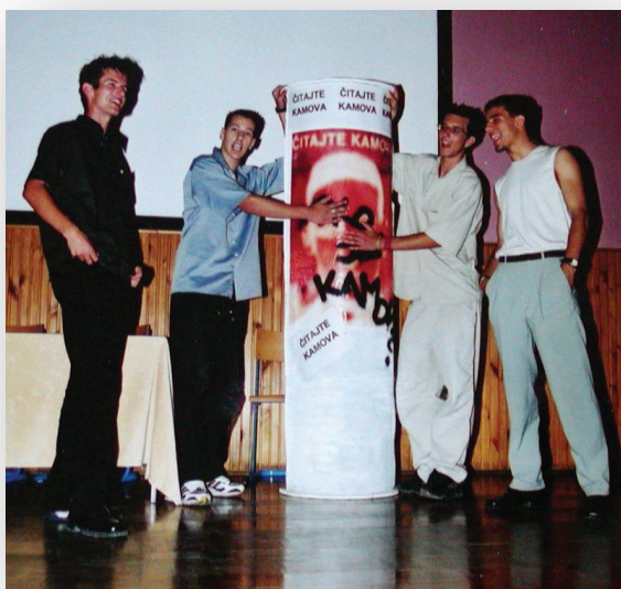
Slika 1. Scenska igra „Čitamo Kamova“