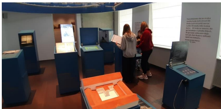
Slika 12. Mlade knjižničarke u potrazi za „blagom“ u Palači šećerane

Nakon tiskare prošetali su prostorom Palače šećerane gdje su tražeći razne odgovore u postavu muzeja na dva kata, pokušavali osvojiti što više bodova i pronaći „blago“. Među mnogobrojnim izlošcima i odjeljcima muzeja u kojima su mogli naučiti više o važnim povijesnim razdobljima grada Rijeke, najviše ih se dojmio odjeljak s interaktivnom „kuhinjom“ gdje su mogle isprobavati i „kuhati“ lokalne recepte te dijelovi muzeja u kojima se može slušati glazba iz šezdesetih, sedamdesetih i osamdesetih godina 20. stoljeća.