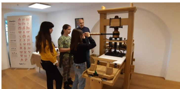
Slika 11. Detalj iz srednjovjekovne glagoljske tiskare u Palači šećerane

Ususret obilježavanju svibanjske Noći muzeja 2023. Mladi knjižničari u pratnji knjižničarke posjetili su riječku Palaču šećerane te su ondje sudjelovali na zanimljivim radionicama u „srednjovjekovnoj tiskari“ i Lovu na blago. Domaćini su im najprije prikazali način rada na izvornoj tiskarskoj preši, pokazali im replike knjiga tiskanih u nekadašnjoj riječkoj tiskari Šimuna Kozičića Benje te ih potom uputili u način miješanja boje i slaganja pomičnih slova kako bi i sami mogli isprobati rad s na preši i izraditi si diplome „glagoljskih stručnjaka“.