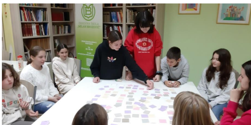
Slika 14. Igranje čakavskog memorija

Posjet su zaokružili neobvezatnim druženjem, razgledom knjižnice i njezina fonda te dogovorom za uzvratni posjet što je prije moguće.