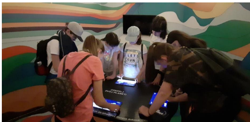
Slika 6. Na izložbi „Mali Princ“ u Exportdrvu

Sljedeća terenska nastava realizirana je već 20. svibnja iste godine i to s dvostrukim ciljem: valjalo je iskoristiti jedinstvenu priliku te posjetiti i razgledati putujuću izložbu „Mali princ“ u Exportdrvu gdje su aktivno sudjelovali u zanimljivim igrama prolazeći kroz šarene “prostorije” inspirirane poznatim scenama iz ovog književnog klasika, a povodom obilježavanja Noći muzeja dogovoren je i posjet riječkome Muzeju farmacije u Užarskoj ulici. Ondje su ih domaćini proveli kroz prostor koji odaje počast gotovo svim povijesnim ličnostima, aparaturi i literaturi ove zanimljive grane medicinske znanosti, a sudjelovali su i na praktičnoj radionici izrade kreme za ruke.