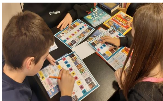
Slika 10. Radionica klasificiranja fonda

Ususret obilježavanju svibanjske Noći muzeja 2023. Mladi knjižničari u pratnji knjižničarke posjetili su riječku Palaču šećerane te su ondje sudjelovali na zanimljivim radionicama u „srednjovjekovnoj tiskari“ i Lovu na blago. Domaćini su im najprije prikazali način rada na izvornoj tiskarskoj preši, pokazali im replike knjiga tiskanih u nekadašnjoj riječkoj tiskari Šimuna Kozičića Benje te ih potom uputili u način miješanja boje i slaganja pomičnih slova kako bi i sami mogli isprobati rad s na preši i izraditi si diplome „glagoljskih stručnjaka“.