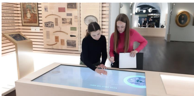
Slika 13. Digitalno kuhanje tradicionalnih primorskih recepata

Ovogodišnji Mjesec hrvatske knjige, ali ponajprije Mjesec školskih knjižnica započeo je lijepom novom suradnjom s knjižnicom Osnovne škole „Milan Brozović“ u Kastvu. Članovi Mladih knjižničara OŠ „Srdoči“ posjetili su knjižnicu susjedne škole u Kastvu te su se ondje upoznali sa svojim kolegama i zajedno s njima sudjelovali na čakavskoj radionici koju je za njih pripremila kastavska knjižničarka Karmen Šimetić. Učenici su tijekom kviza odgonetali zanimljive puzzle s čakavskim izjavama, igrali memori u kojemu je trebalo upariti čakavsku riječ s njezinim ekvivalentom u standardu (čizme-škornje, cipele-postoli, vilica-pirun, tanjur-pijat, kiša-daž, duga-mavrica itd.), a potom su još morali zapamtiti što više ponuđenih