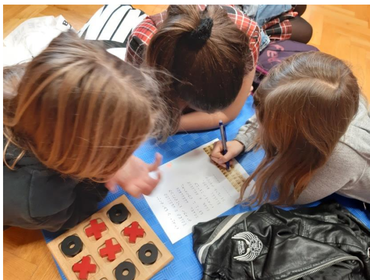
Slika 3. Dešifriranje brajčnih slova i taktilna društvena igra

Zbog epidemije bolesti COVID-19 sljedeća terenska nastava organiziranja je i ostvarena tek u travnju 2022. godine (u povodom obilježavanja Dana dječje knjige), a najbolja moguća lokacija za to bila je Dječja kuća i Dječja knjižnica Stribor.