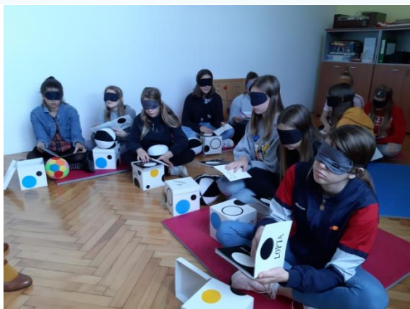
Slika 1. „Čitanje“ s povezom na očima

Posljednje dvije aktivnosti bile su „odgonetanje“ brajčnih slova s pomoću sheme te njihovo tipkanje na specijaliziranom stroju, a druženje su završili igranjem različitih društvenih igara – s povezom na očima.