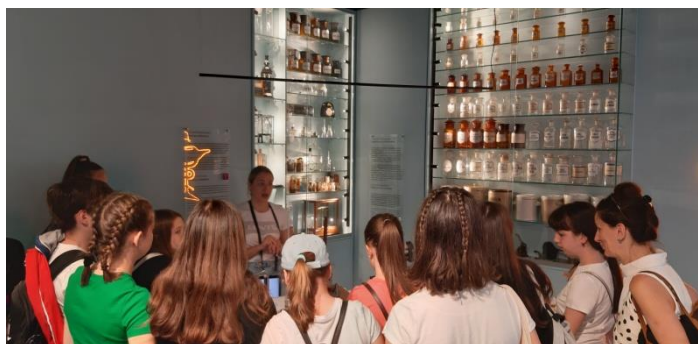
Slika 7. Na uvodnom predavanju u Muzeju farmacije

Sljedeća terenska nastava realizirana je već 20. svibnja iste godine i to s dvostrukim ciljem: valjalo je iskoristiti jedinstvenu priliku te posjetiti i razgledati putujuću izložbu „Mali princ“ u Exportdrvu gdje su aktivno sudjelovali u zanimljivim igrama prolazeći kroz šarene “prostorije” inspirirane poznatim scenama iz ovog književnog klasika, a povodom obilježavanja Noći muzeja dogovoren je i posjet riječkome Muzeju farmacije u Užarskoj ulici. Ondje su ih domaćini proveli kroz prostor koji odaje počast gotovo svim povijesnim ličnostima, aparaturi i literaturi ove zanimljive grane medicinske znanosti, a sudjelovali su i na praktičnoj radionici izrade kreme za ruke.