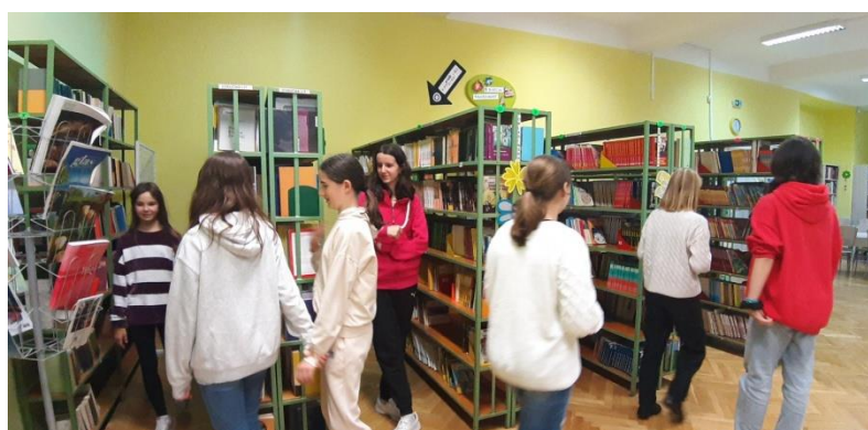
Slika 15. Razgledavanje fonda i prostora kastavske školske knjižnice