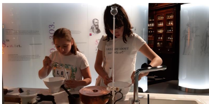
Slika 8. Detalj s radionice izrade biljne kreme