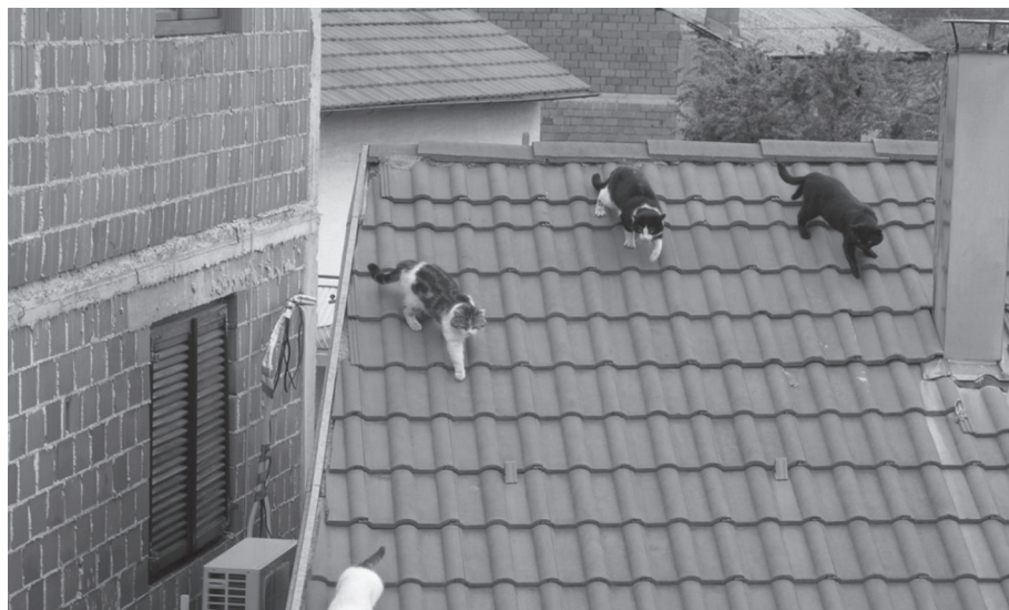
Foto 2: Krovne, slobodnoživuće mačke, 2004. Dubrava, Zagreb – mačke koje preživljavaju na krovovima.