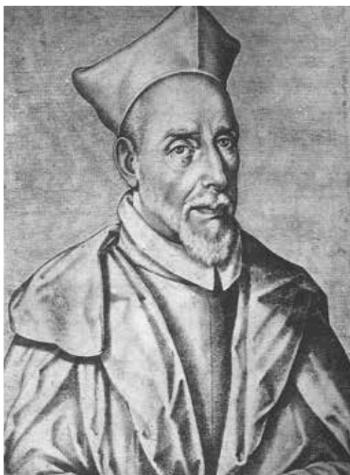
Slika 2. Francisco Guerrero El Maestro (1528. – 1599.)