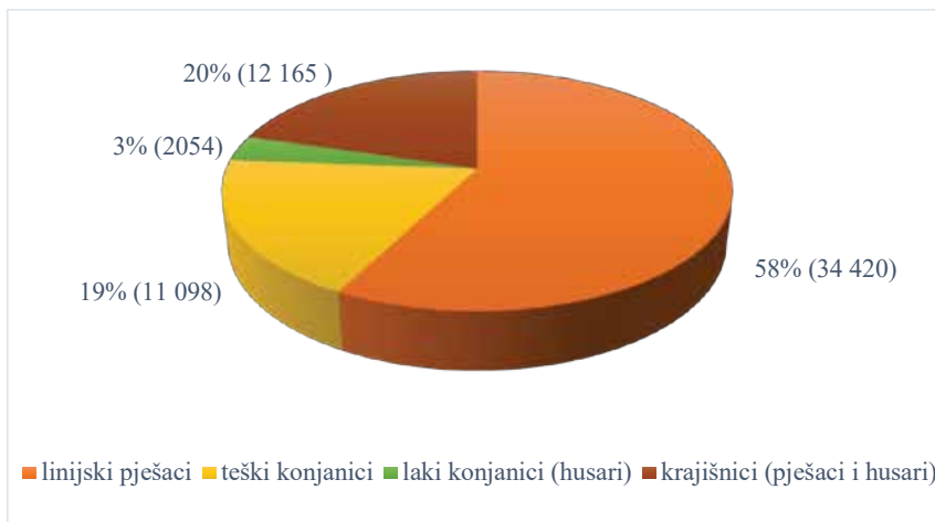
Grafikon 2. Sastav Laudonove vojske 1760. godine