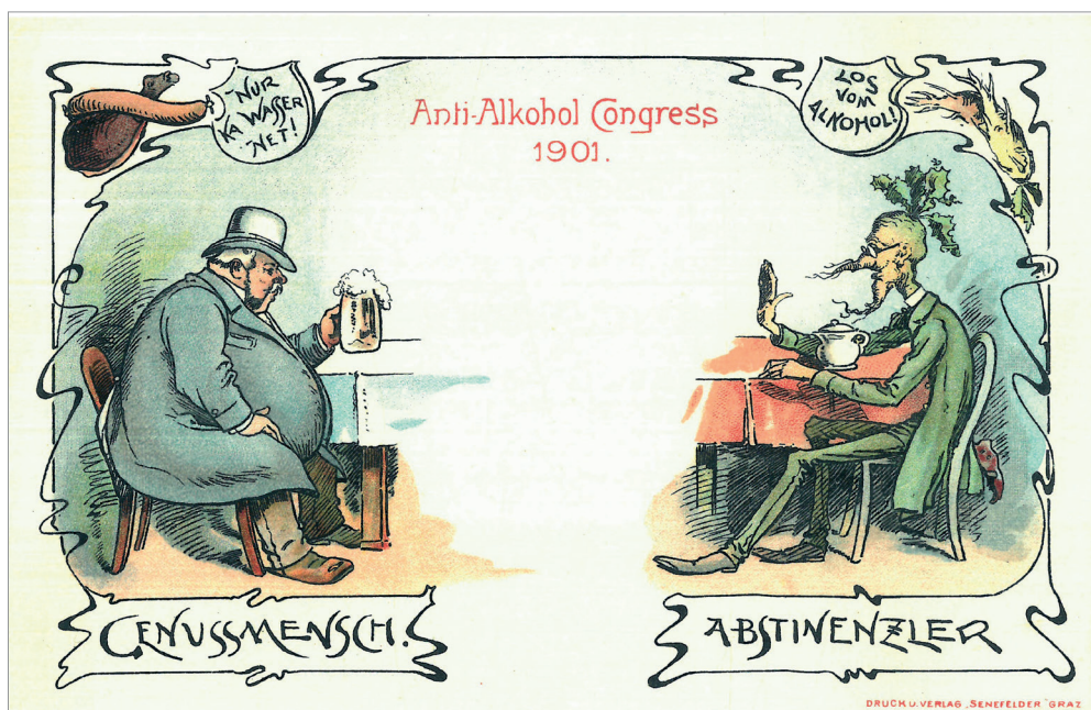
Slika 4. Anti-Alkohol Congress 1901., razglednica, 1901.