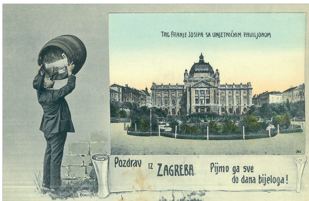
Slika 3. Pozdrav iz Zagreba. Pijmo ga sve do dana bijeloga!, razglednica, 1908.