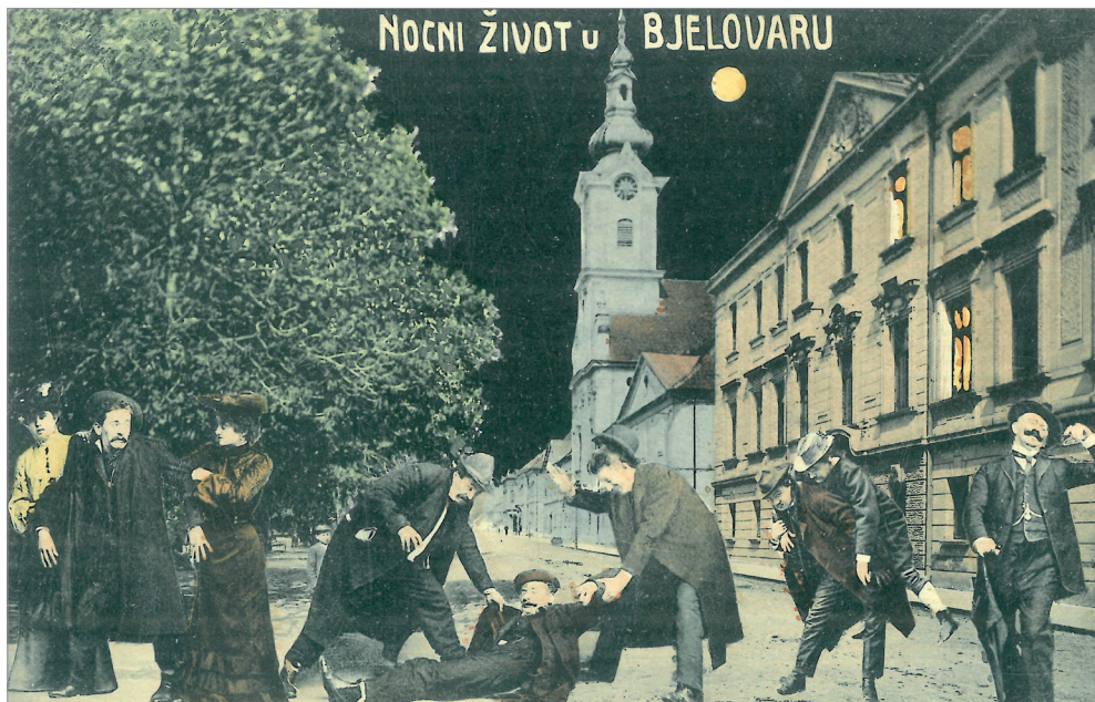
Slika 2. Noćni život u Bjelovaru, razglednica oko 1910.