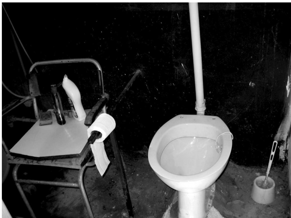
Fotografija 6. Autorka Gordana: "Loši stambeni uslovi", Vojvodina 2015.

Vidite kakva je wc šolja. Je l' vidite da nema nijedne pločice. (...) I ne može dedu da uguram sa kolicima u kupatilo da bi ga okupala, nego ja njemu, evo sad je toplo, svako popodne iznesem mu lavor pun vode mlake i stavim mu šampon u vodu i tako kako sedi u kolica ja ga tako operem. Pa zato što je malo kupatilo i zato što wc šolja hoće da pukne, stara je, a novaca nemamo da kupimo. (...) Tu je deda dok je imao nogu, tu je stolica i tu je sedeo, tu je mogao da se kupa (...) a sad nažalost, vrata su uzana, tako su majstori mu stavili vrata, nisu stavili normalno nego uže i sad njegova kolica ne mogu da uđu unutra. (...) Pa, na primer eto da se samo naprave veća vrata ja bih bila zadovoljna, da bih ja