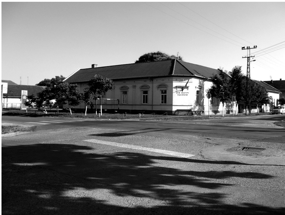
Fotografija 1. Autorka Tatjana: "Bezbednost u saobraćaju", Vojvodina, 2015.

Tatjana ističe pitanje ugrožene bezbednosti saobraćaja, ali i nedostupnosti različitih sadržaja koji izostaju zbog loše povezanosti ruralnog naselja s gradskim centrom, koja nju kao osobu s invaliditetom, dodatno gura u izolaciju: