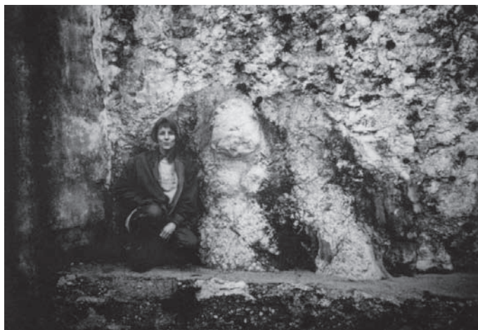
Slika 6: Grobnička baba, snimila J. Vince Pallua 1996.