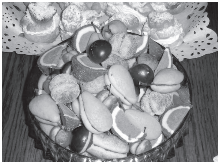
Slika 5: Svadbeni kolači gljive u posudi s kolačima u obliku raznovrsnog voća, Dragoslavec-Breg, 2012.