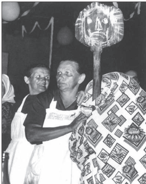
Slika 1: Scenska igra "Baba gljive brala", Goričan, 1975. (Hranjec 2011:244)