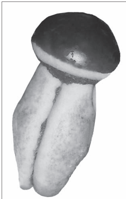
Slika 4: Svadbeni kolač gljiva, Dragoslavec-Breg, 2012.