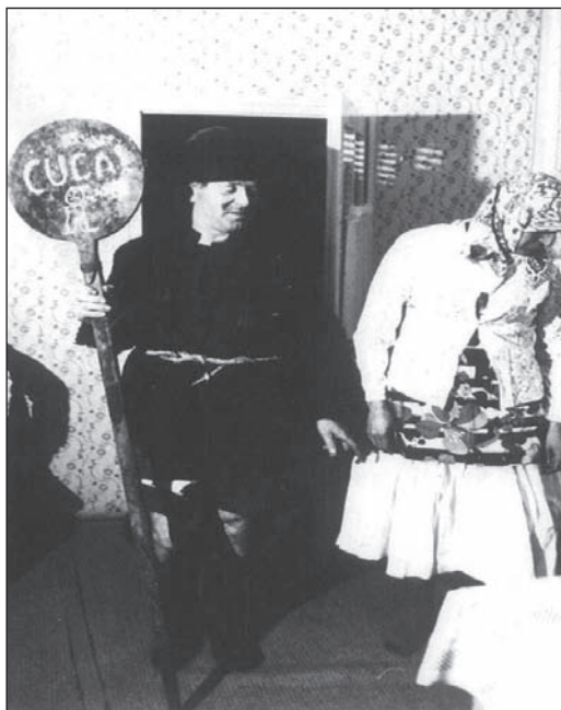
Slika 2: Baba i deda u svadbenoj dramskoj igri "Baba gljive brala", Nedelišće, 1975. (Hranjec 2011:243)