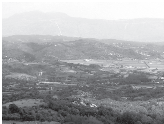
Slika br.1 Pićanska polja, fotografija autorice

naselja akropolskog tipa smještaju na uzvisinama, glavna su polja u podnožju, upravo u prostoru hidrološkog obilja ili oscilacija (Sl. 1.). Upravo su ti hidrološki objekti (potoci, jaruge, polja) i glavna žarišta endemičnih bolesti. Utjecaj je močvara u Istri zbog njihova malog broja bio neznatan. Utvrđena je i korelacija nastanka bolesti s malom nadmorskom visinom 12 na kontaktima propusnih i nepropusnih slojeva u kršu i zadržavanjem voda na području Puljštine (Sl. 2.), Poreštine, Bujštine, Čepičkog jezera i doline Mirne. Još je u 19. stoljeću Schiavuzzi prostore na slojevima gline, na nadmorskoj visini ispod 200 m n.v., koji su rijetko naseljeni i obiluju vodotocima, odnosno vlažnim tlom, prepoznao kao pogodne za razvoj malarije. Pritom je malaričnost bila obrnuto recipročna naseljenosti, odnosno obrađenosti terena. Posebno su »opasni« za širenje malarije bili gusti šumarci sa slabom cirkulacijom zraka i malim amplitudama temperature te krajevi s ispodprosječno malo padalina u 2. i 3. trimestru, malim fluktuacijama temperature te s maksimumom od 11° do 18°C između ožujka i listopada te minimumom od 5° do 11°C u istom razdoblju. 13