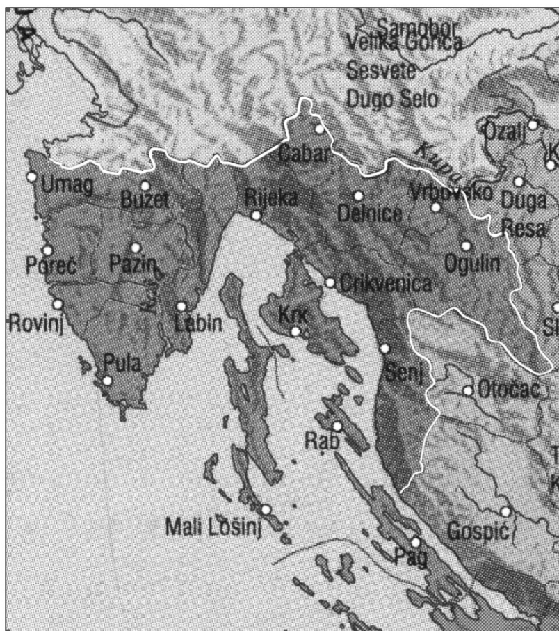
Slika br. 2

Područje zajednice općina kvarnersko-goransko-istarskog područja obuhvaća područje općina: Rijeka, Buje, Buzet, Crikvenica, Čabar, Delnice, Krk, Labin, Mali Lošinj, Novigrad, Ogulin, Opatija, Pag, Pazin, Poreč, Pula, Rab, Rovinj, Senj, Umag i Vrbovsko. 76