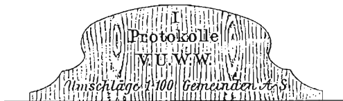
Slika 2. Slika ormara za katastarske planove Arhiva mapa