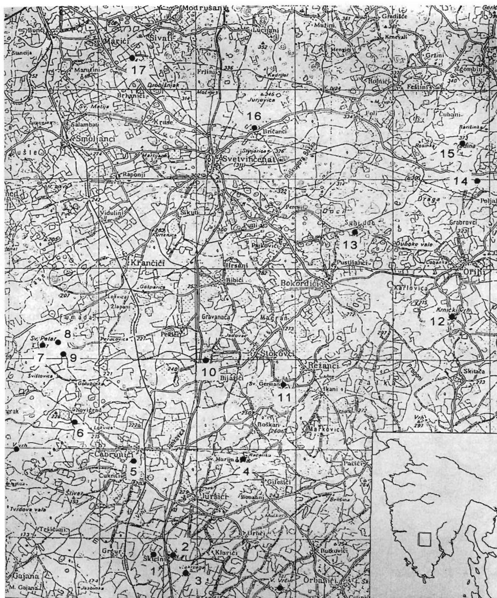
Sl. 1. Popis nalazišta na području Svetvinčenta:

1. Škicini – Kažali, kasnoantički nalaz; 2. Škicini, prapovijesni nalaz; 3. Lakoršaga, prapovijesni nalaz; 4. Sv. Marija od tri kunfina, crkva; 5. Turki, antički nalaz; 6. Gradina, prapovijesni nalaz; 7. Sv. Petar, crkva; 8. Tondolon, prapovijesni nalaz; 9. Glavica, prapovijesni nalaz; 10. Soline – Sohe, prapovijesni nalaz; 11. Markovica – Sv. German, antički i srednjovjekovni nalaz; 12. Krnički vrh, prapovijesni nalaz; 13. Sui dub, antički nalaz; 14. Rogatice, prapovijesni nalaz; 15. Stari Gočan, kompleksni lokalitet; 16. Bričanci, slučajni nalaz; 17. Peščine, prapovijesni nalaz.