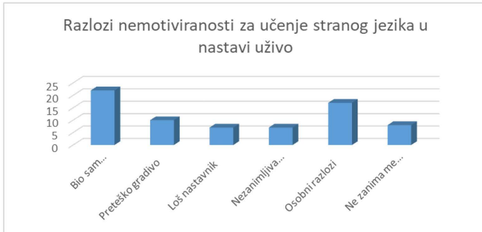
Slika 3. Navedite razloge zbog kojih niste motivirani za učenje stranog jezika uživo