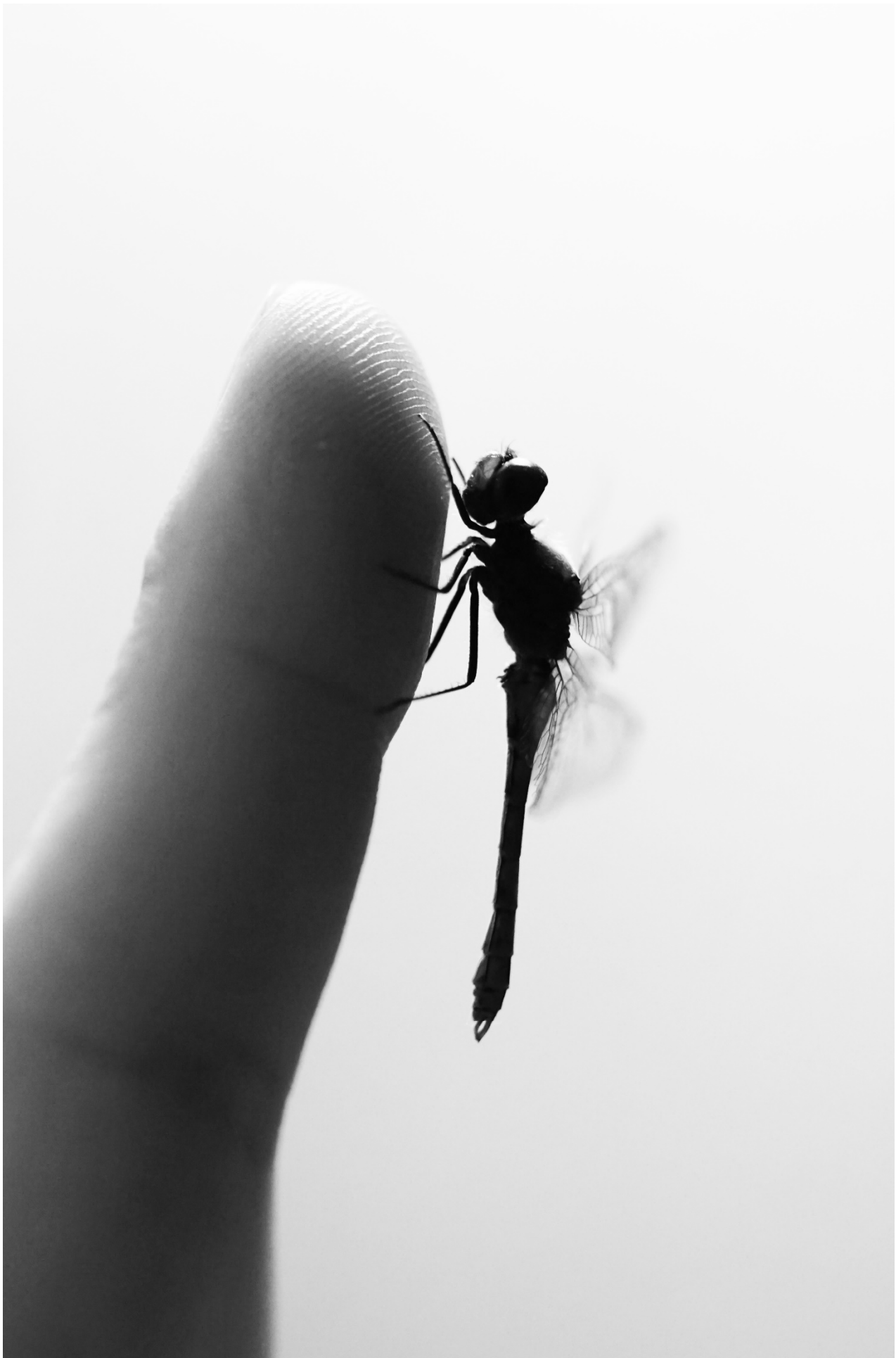
Photo 034. Vilin konjic / Dragonfly