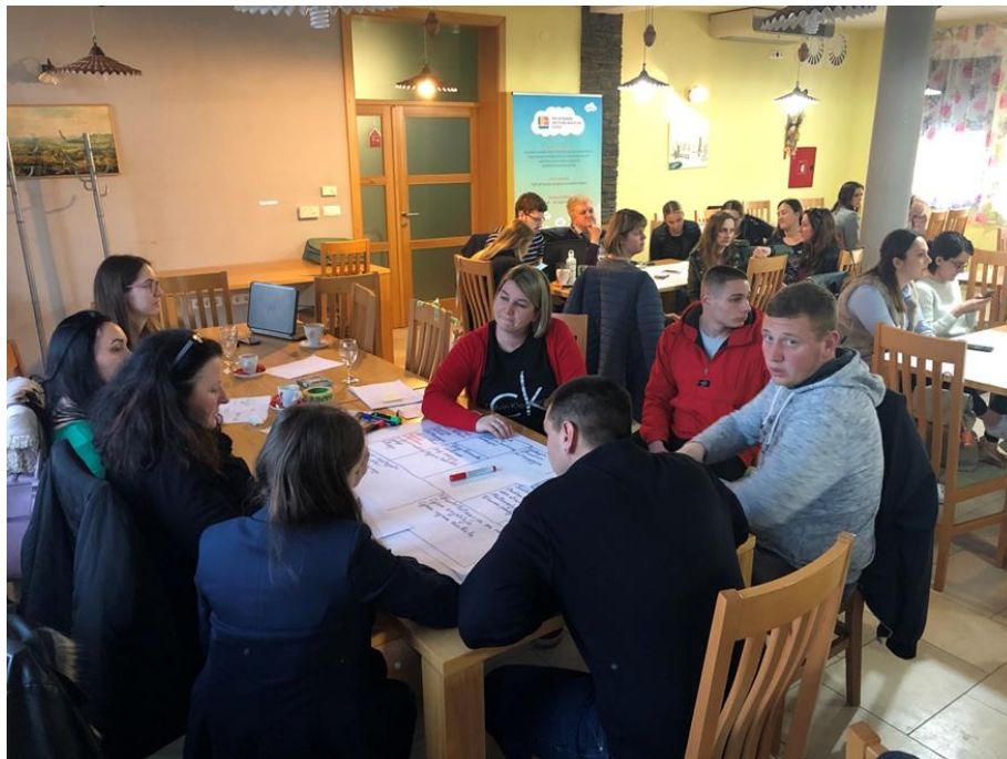
Slika 1: Održani hub u Štrigovi u Međimurju