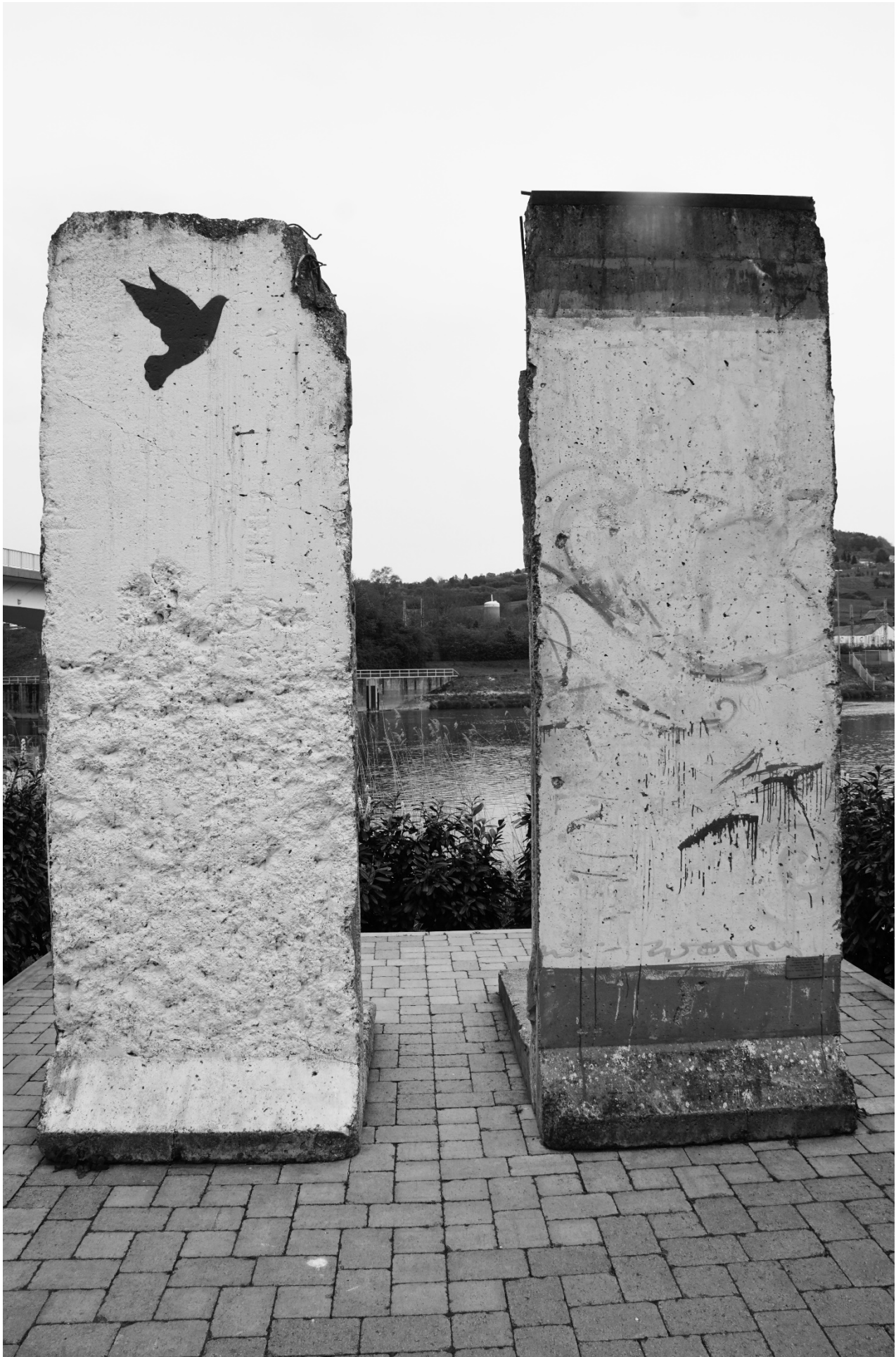
Photo 033. Dio Berlinkog zida u Schengenu / Part of the Berlin Wall in Schengen