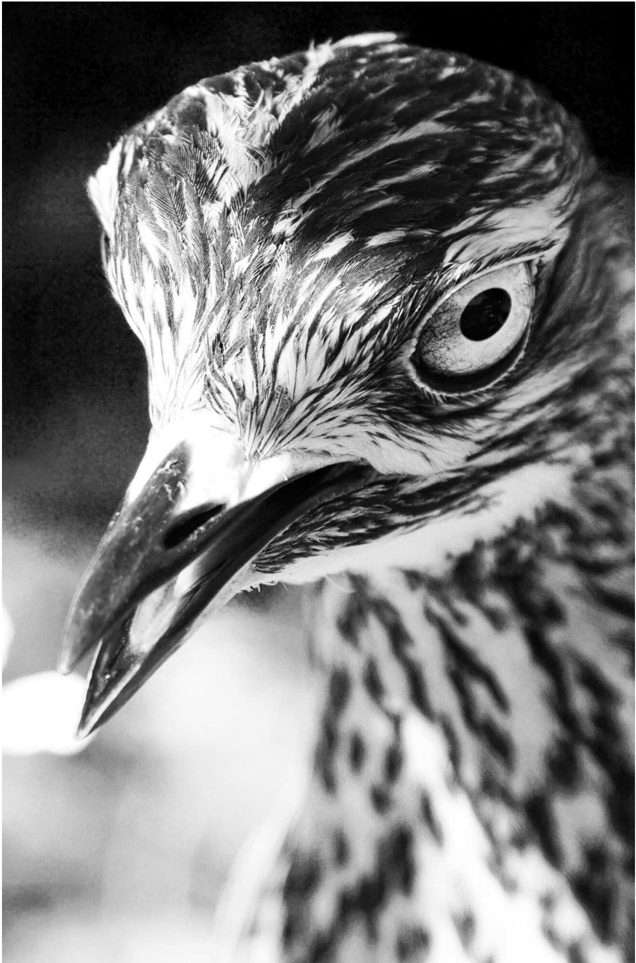
Photo 062. Ptica / Bird