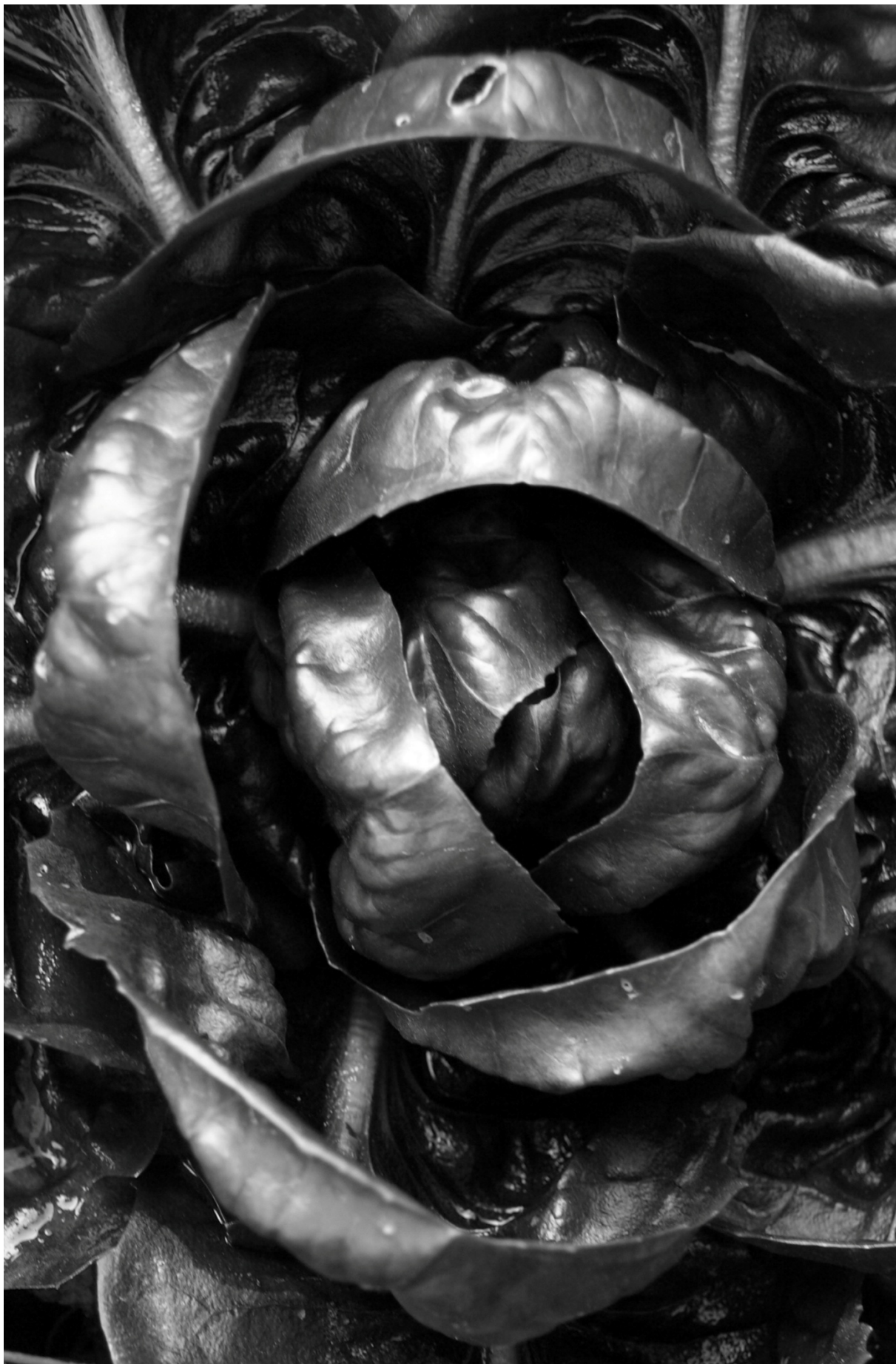
Photo 047. Salad / Salata