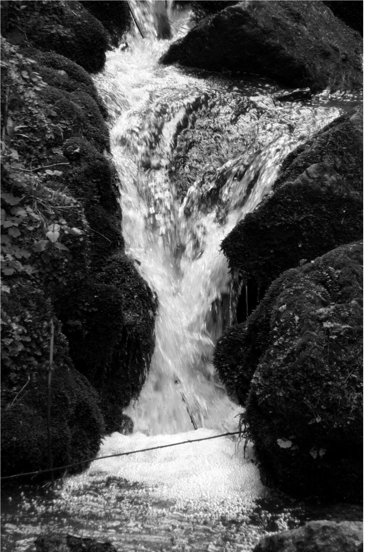
Photo 057. Waterfall / Slap